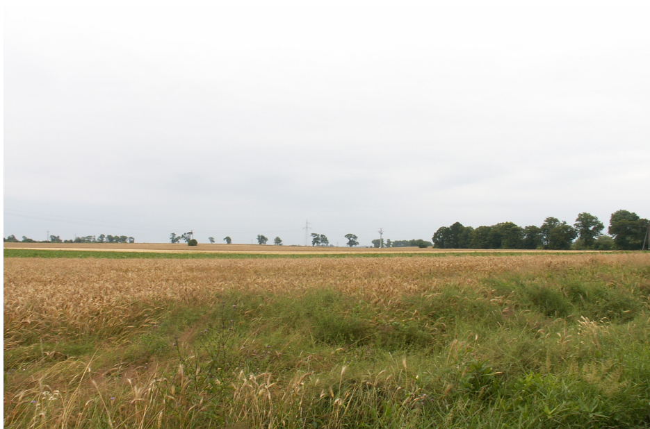
Fot. 1. Krajobraz Białowieży