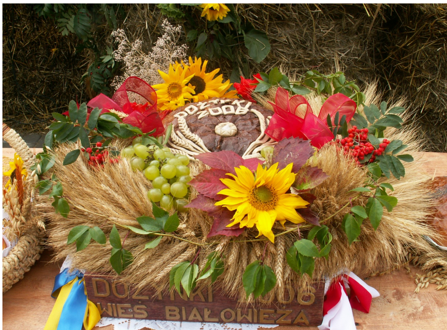
Fot. 6. Dożynki Gminne 2006r.