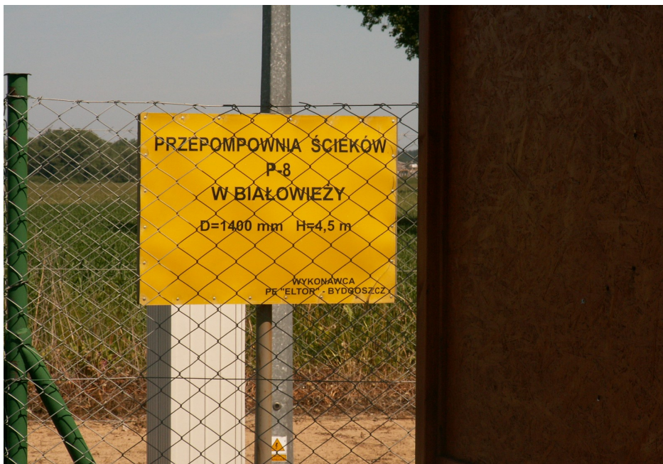
Fot. 8. Przepompownia ścieków