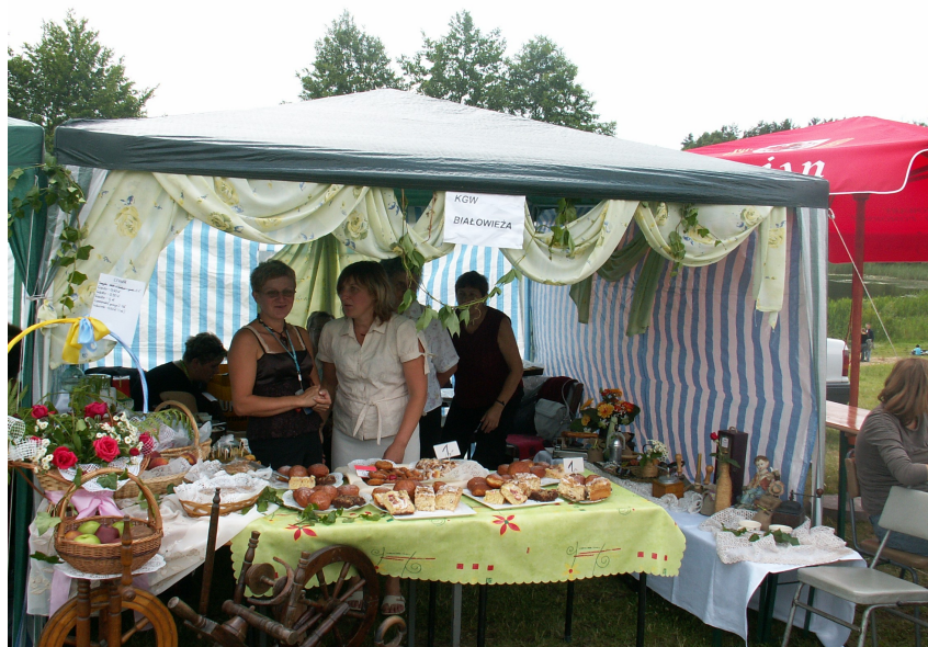
Fot. 12. Stoisko KGW Białowieża