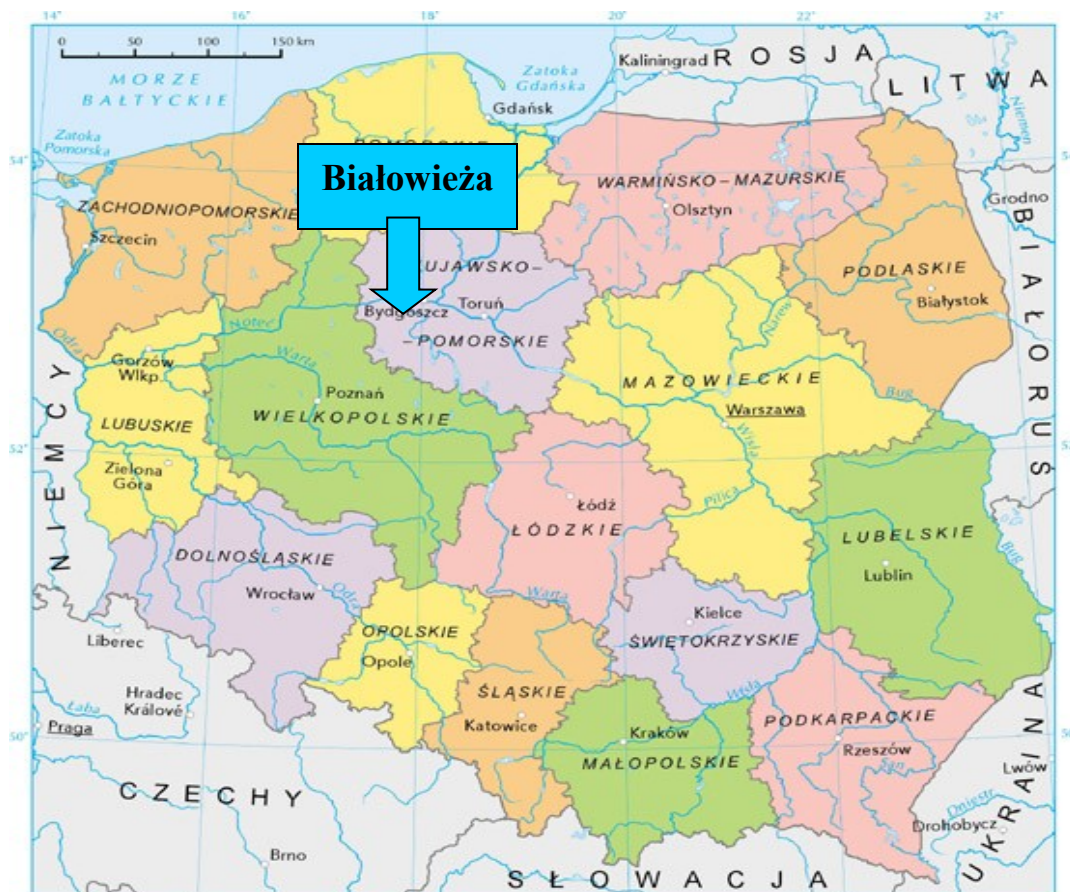
Mapa 1. Położenie Białowieży na tle kraju i województwa.

Białowieża położona jest w województwie kujawsko - pomorskim, powiecie nakielskim, w zachodniej części gminy Mrocza. Graniczy z takimi sołectwami jak: Wiele, Witosław, Matyldzin. Białowieża graniczy z miastem Mrocza. Dzisiejsze przysiółki: Jadwigowo, Orlinek. Wieś usytuowana jest między dopływami Rokitki z drogą do Łobzenicy w parafii zabartowskiej.