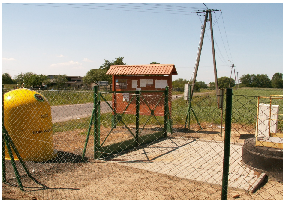
Fot. 9. Kompleks – przepompownia ścieków, pojemniki do segregacji odpadów oraz tablica informacyjna Białowieży.

W miejscowości brak jest boiska sportowego.