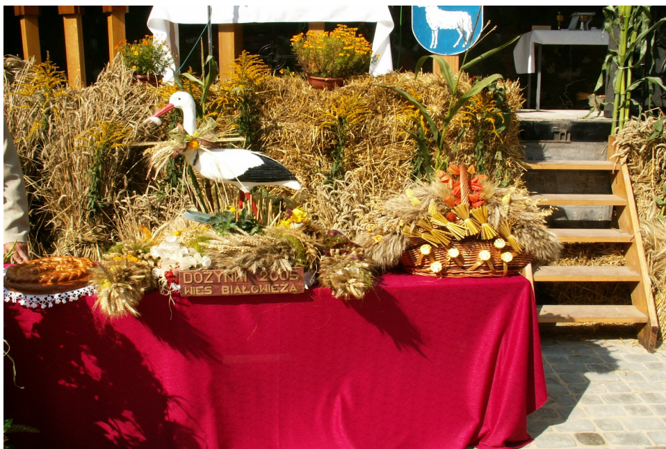
Fot. 4. Dożynki Gminne w Witosławiu 2005r. – wieniec dożynkowy Białowieży