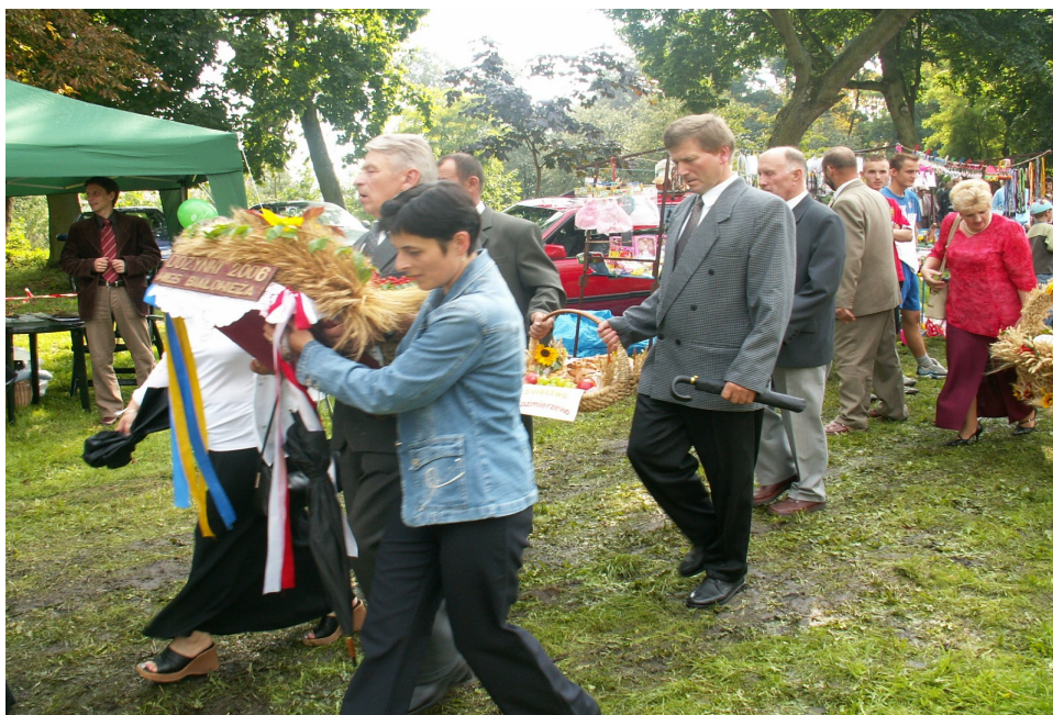
Fot. 5. Dożynki Gminne w Witosławiu 2006r.