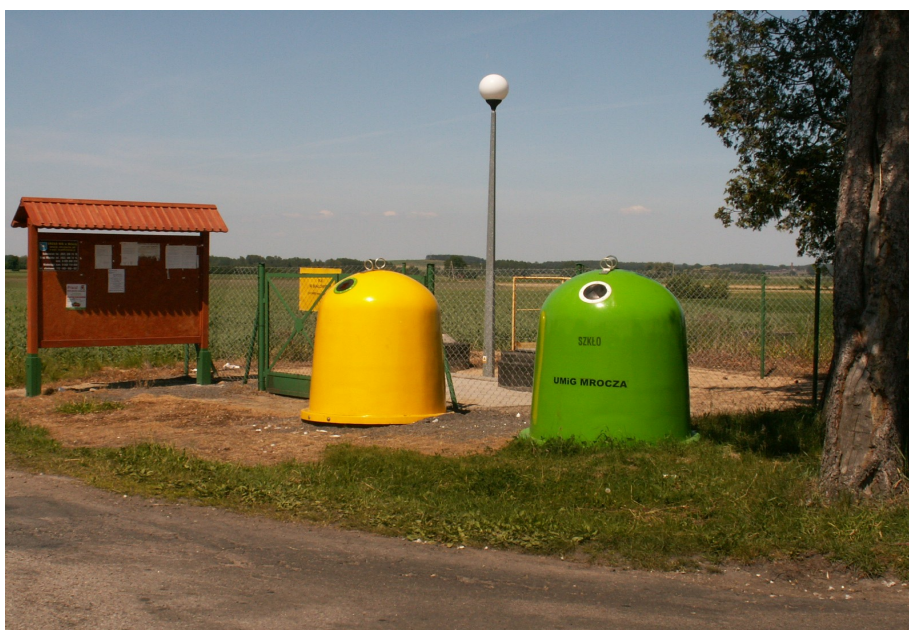
Fot. 7. Pojemniki do segregacji odpadów w Białowieży

W Białowieży jest także sklep spożywczy.