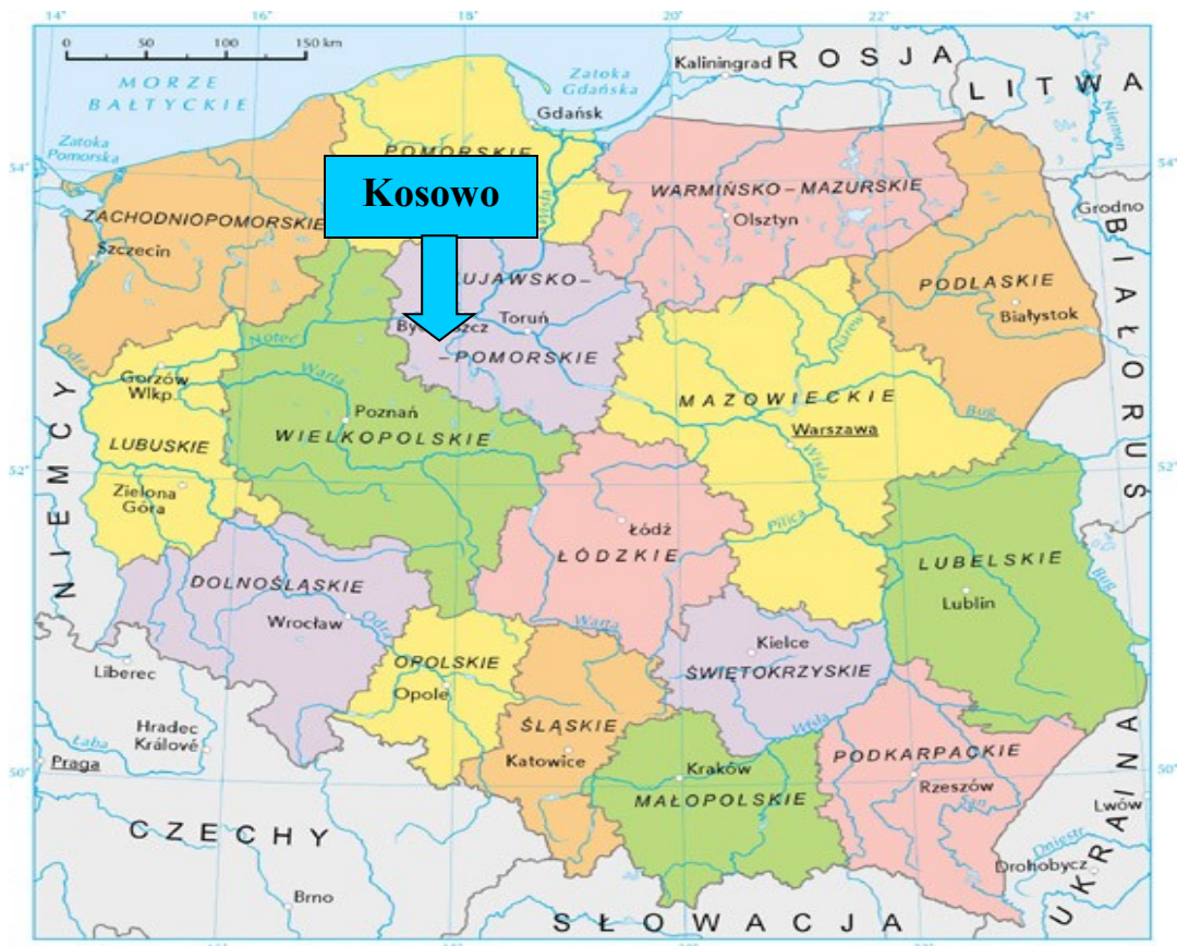
Mapa 1. Położenie Kosowa na tle kraju i województwa.