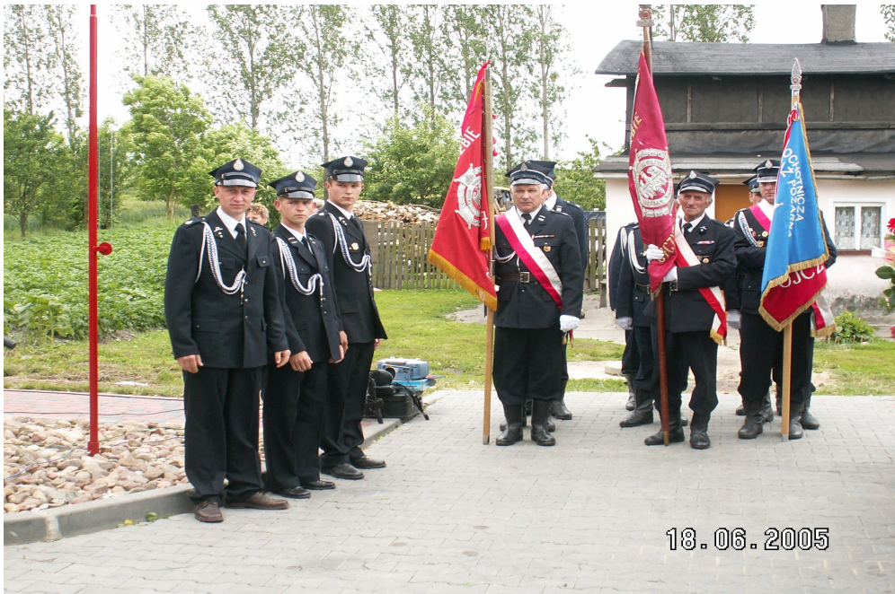
Otwarcie remizy w Kosowie, czerwiec 2005r.