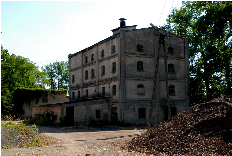
Gorzelnia w Kosowie