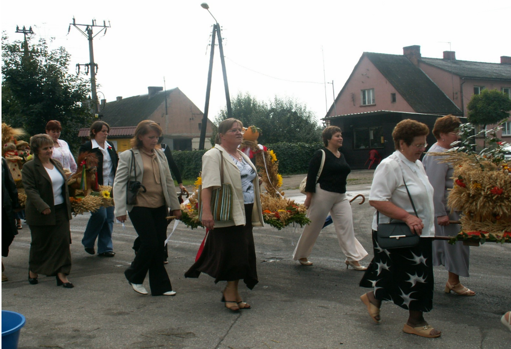
Fot.1. Dożynki Gminne w Witosławiu