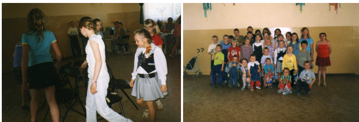
Fot.6 Dzień Dziecka