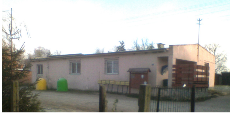
Fot.7 Świetlica wiejska