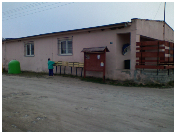
Fot. 10 Sklep spożywczy