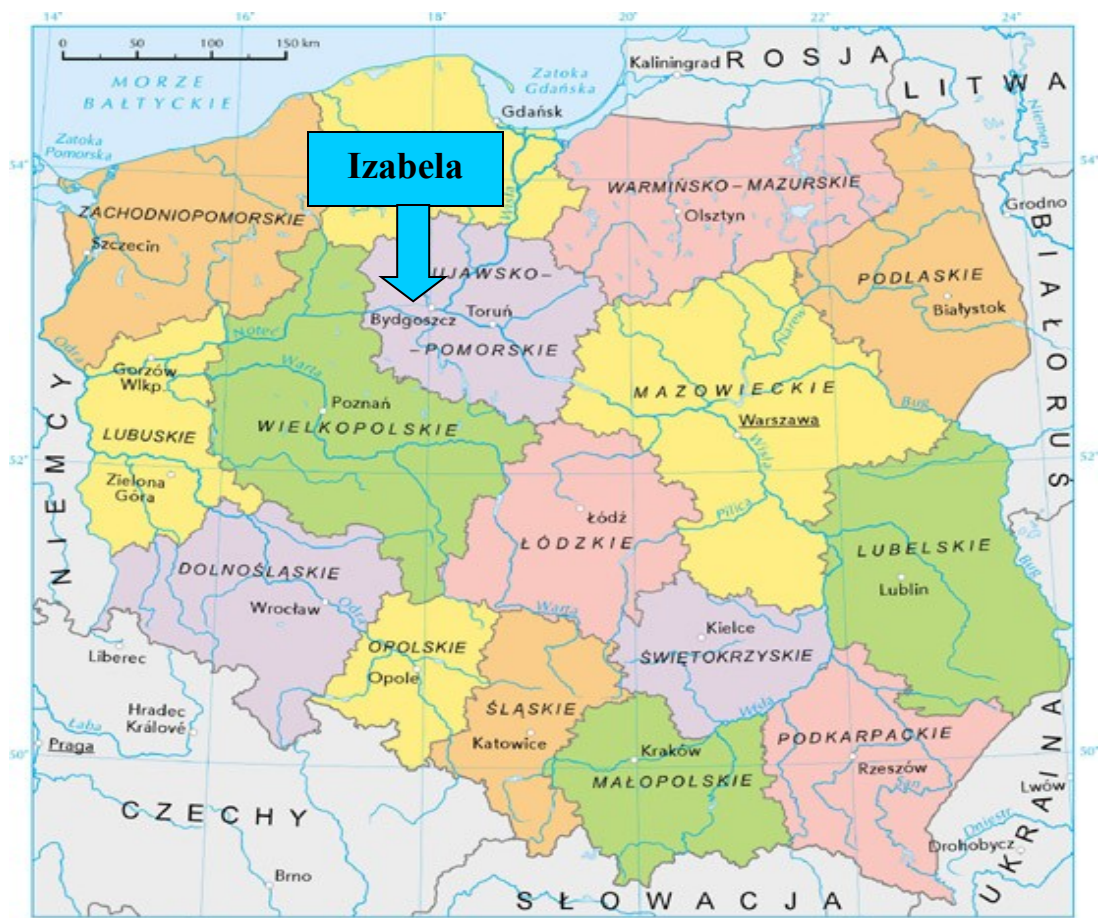
Mapa 1. Położenie Izabeli na tle kraju i województwa.