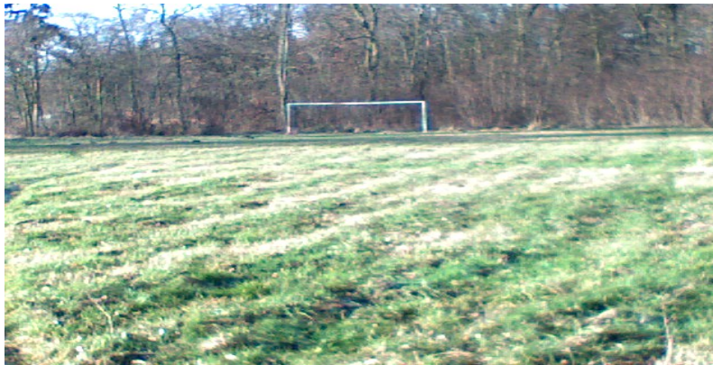
Fot. 8 Boisko sportowe