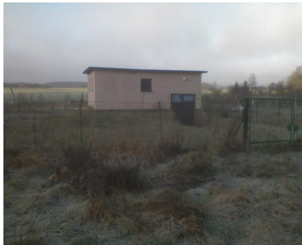
Fot. 9 Budynek hydroforni