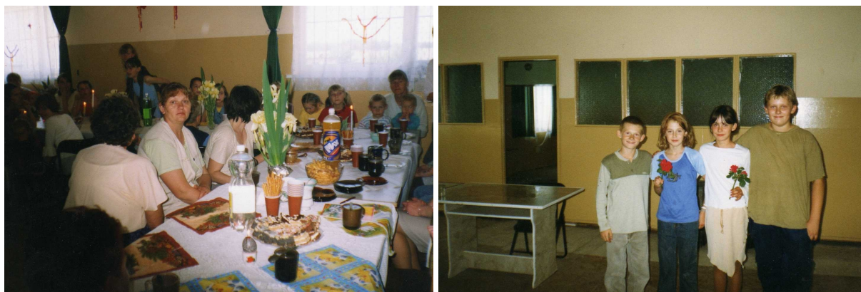
Fot. 5 Dzień Kobiet i Dzień Matki

Obecnie mieszkańcy wsi organizują imprezy okolicznościowe tj. (Dzień Dziadka i Babci, Dzień Kobiet, Dzień Matki, Dzień Dziecka, Dzień Ojca, Mikołajki oraz Gwiazdkę) imprezy plenerowe, itp.