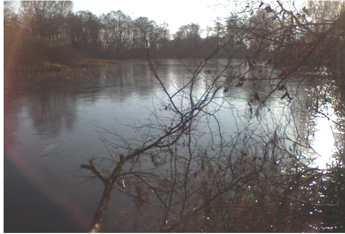
Fot.2 Stawy i rozlewiska