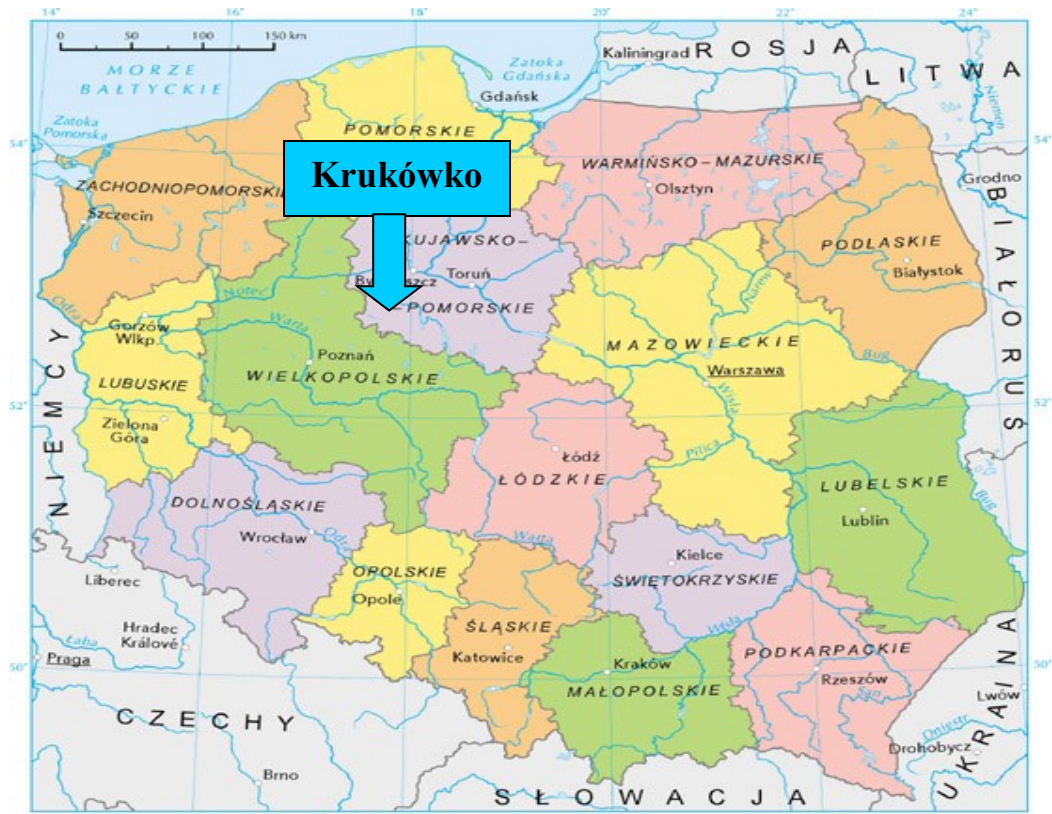
Mapa 1. Położenie Krukówko na tle kraju i województwa.