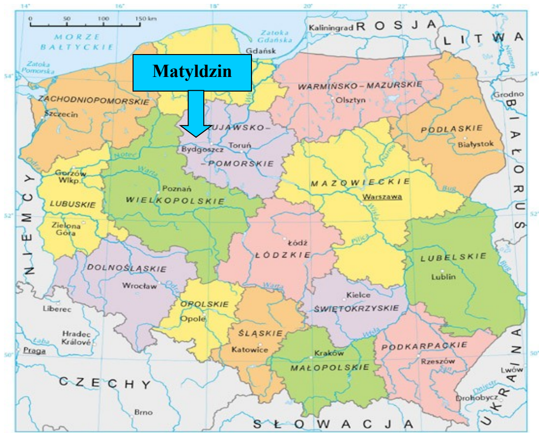
Mapa 1. Położenie Matyldzina na tle kraju i województwa

Matyldzin położony jest w województwie kujawsko-pomorskim, powiecie nakielskim w południowo - zachodniej części gminy Mrocza. Graniczy z sołectwem Wyrza, Białowieża, Kaźmierzewo i Krukówko.