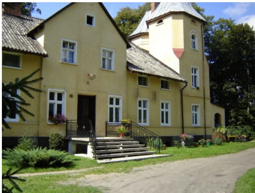
Fot. 2. Pałac XIX w.