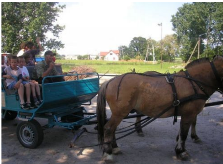
Fot. 5. Przejazd bryczką