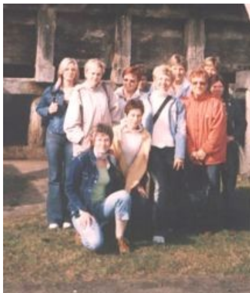
Fot. 11 Zdjęcie z wycieczki do Ciechocinka

Koło Gospodyń Wiejskich w Matyldzinie, zostało złożone w dniu 27.01.2003 r.. Koło liczy 14 osób. Panie z koła gospodyń organizują spotkania opłatkowe, noworoczne, Dzień Kobiet, Dzień Dziecka, grill. Organizują wycieczki, uczestniczą w imprezach takich jak Rościminiada, Dożynki Gminne.