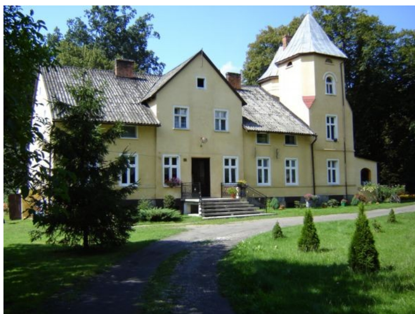
Fot. 1. Pałac z XIX w.

Najbardziej reprezentacyjną częścią dawnego folwarku jest dość dobrze utrzymany i zadbane przez obecnych właścicieli dwór. Powstał on około połowy XIX wieku, a następnie został przebudowany i rozbudowany na początku XX wieku i w roku 1933, o czym świadczy jego ogólna konstrukcja, różnej grubości mury czy stylowa romańska wieża.