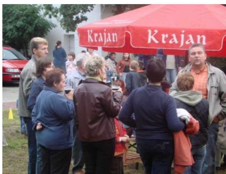
Fot. 7.8.9. Mieszkańcy wsi