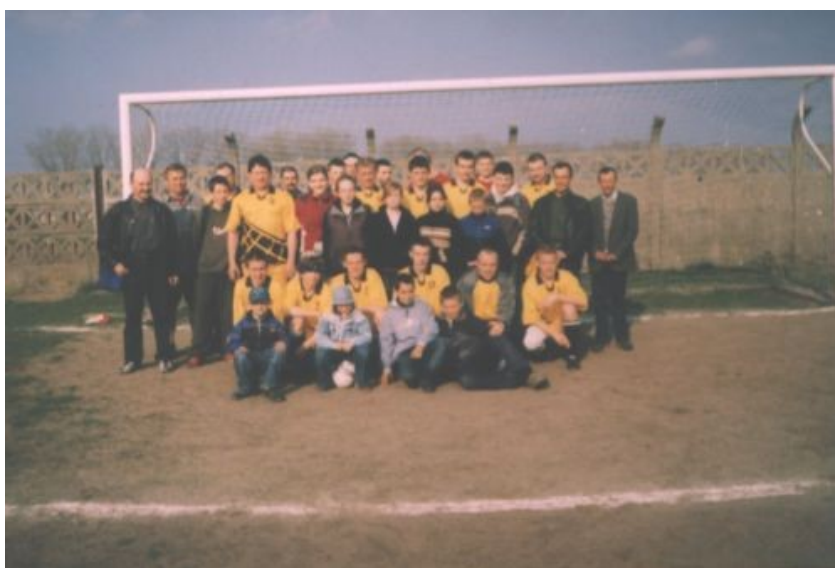
Fot. 12 Młodzi piłkarze wraz z ojcami

Jednak to nie zniechęcało drużyny, która składała się głównie z bardzo młodych chłopaków i ich ojców. Oni grali dla zabawy i wspólnie spędzonych wolnych chwil. Czasem jednak i to się zmieniło. Wielu starszych już zawodników rezygnowało z gry jednak byli inni młodzi i chętni do zabawy. Młoda drużyna po pewnym czasie nabrała doświadczenia i powoli zaczęła odnosić sukcesy, by w sezonie 2006/2007 r. zdobyć tytuł lidera ligi i cieszyć się z takiego tryumfu.