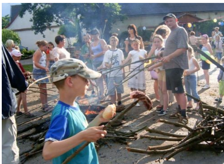
Fot. 6. Wspólne ognisko dla dzieci i rodziców