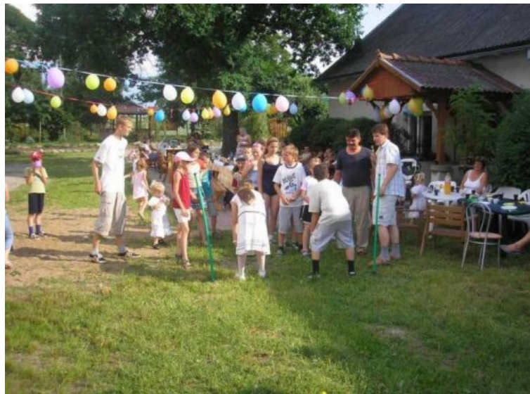
Fot. 4. Gry i zabawy dla dzieci