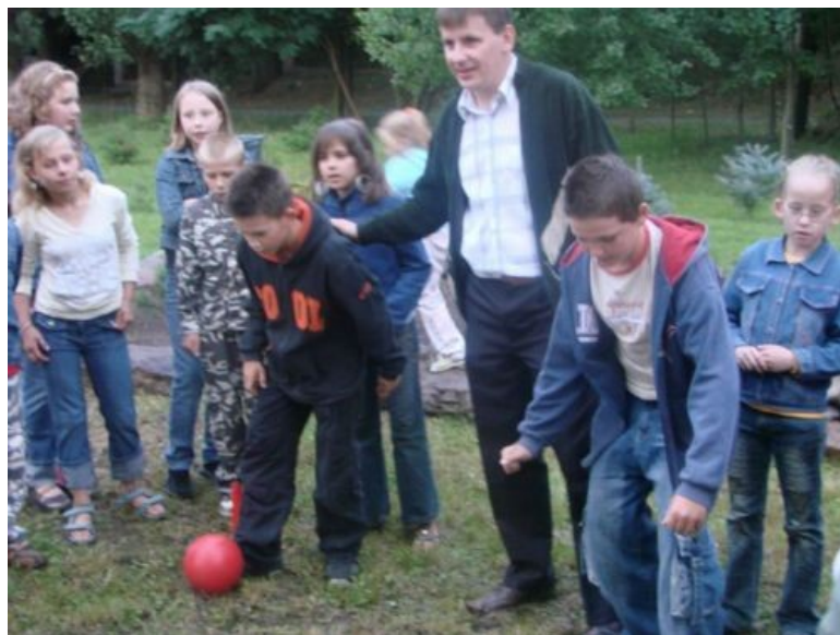
Fot. 10. Gry i zabawy dla dzieci