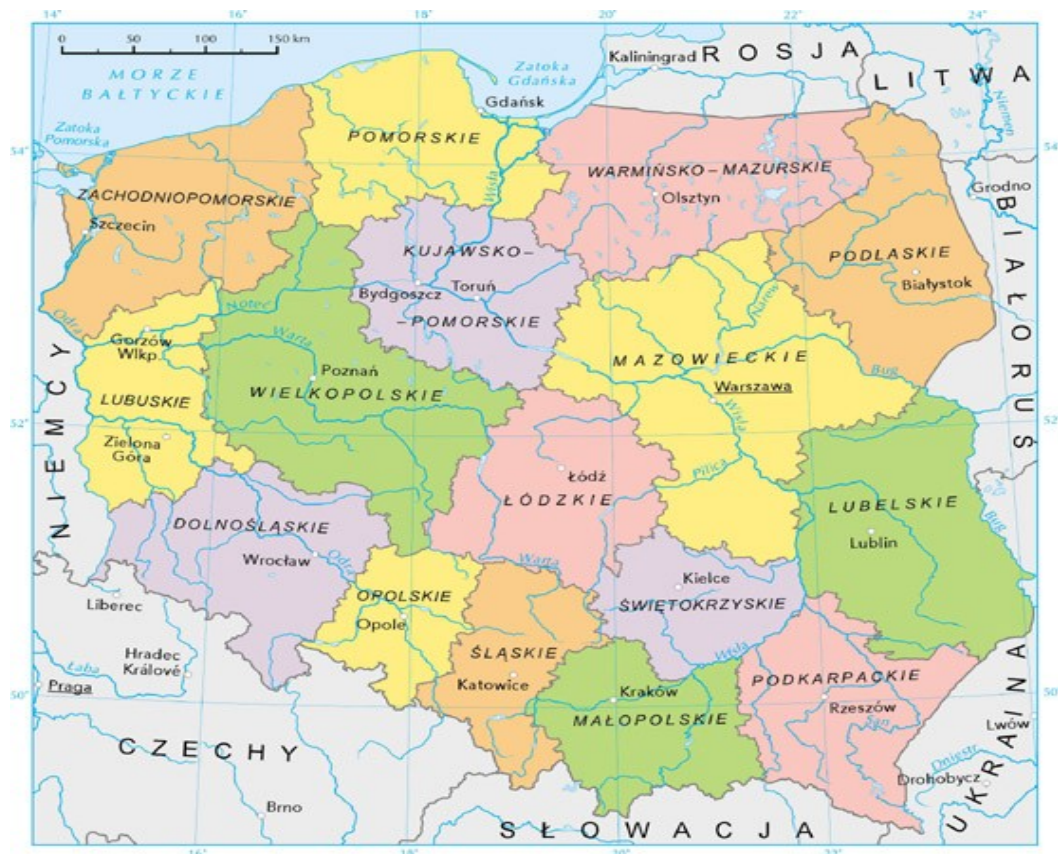
Mapa 1. Położenie Rościmina na tle kraju i województwa.