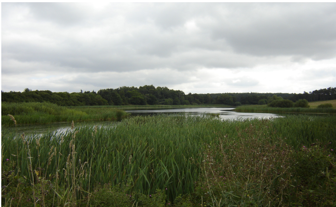
Jeziro Rościmińskie Duże