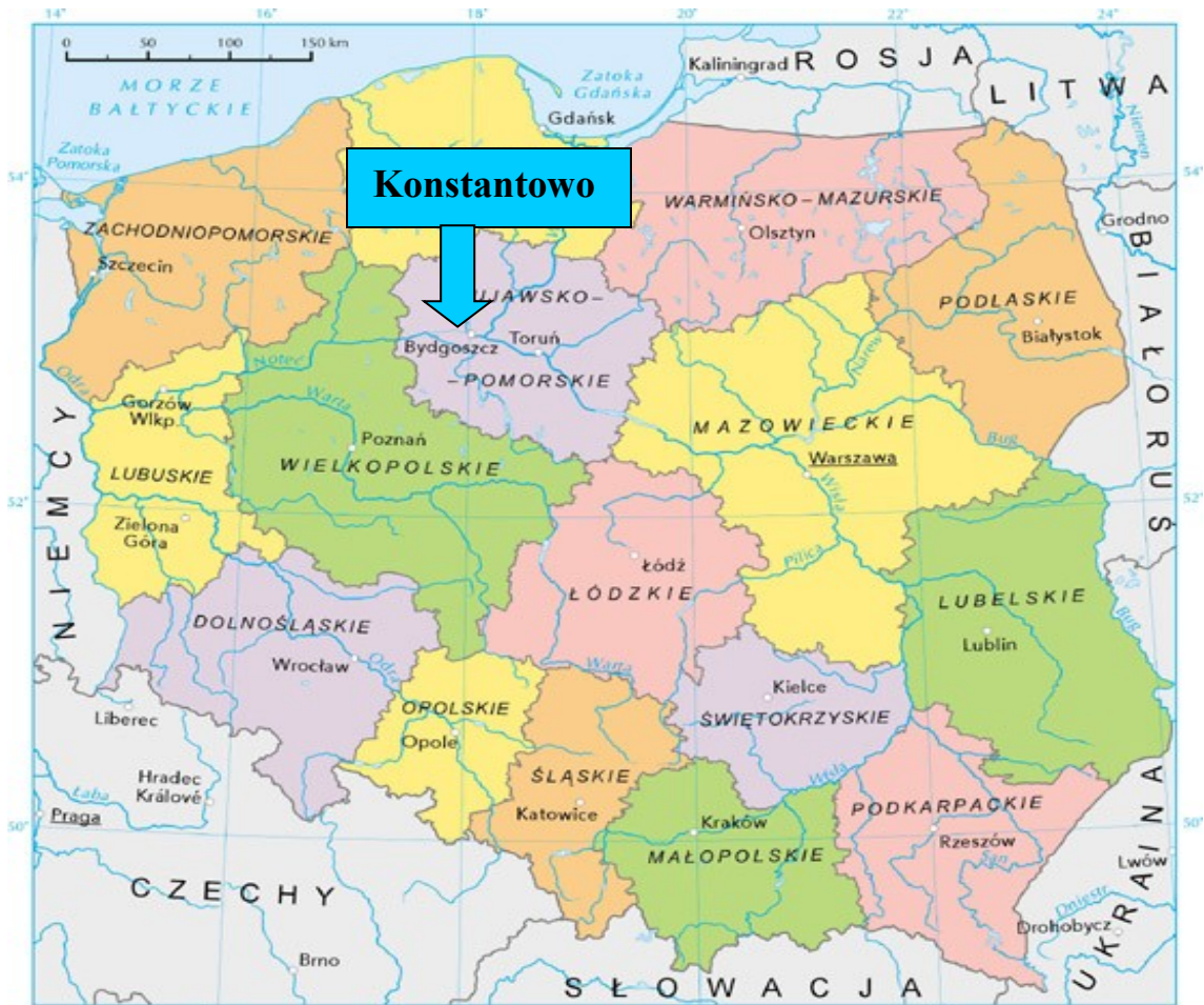
Mapa 1. Położenie miejscowości Konstantowo na tle kraju i województwa.