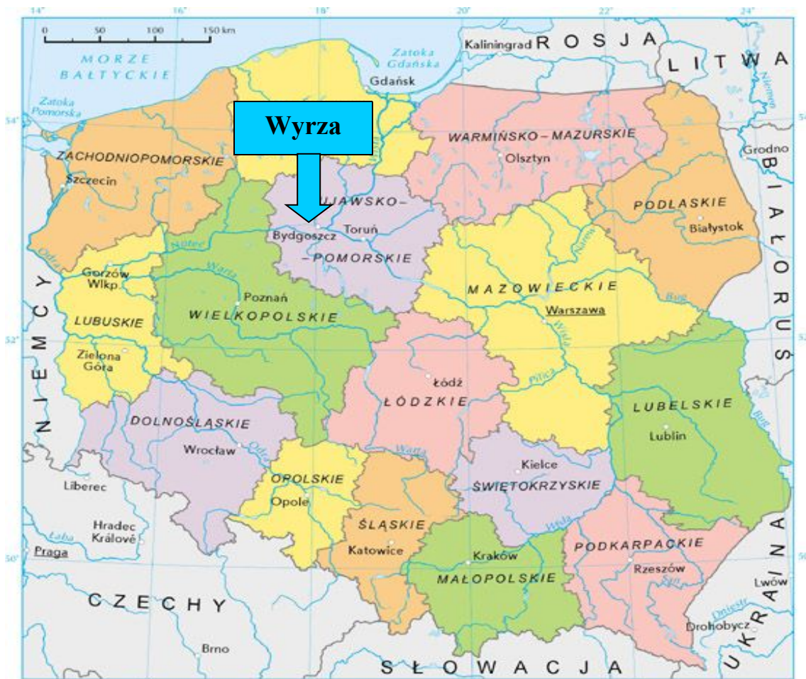
Mapa 1. Położenie Wyrzy na tle kraju i województwa.