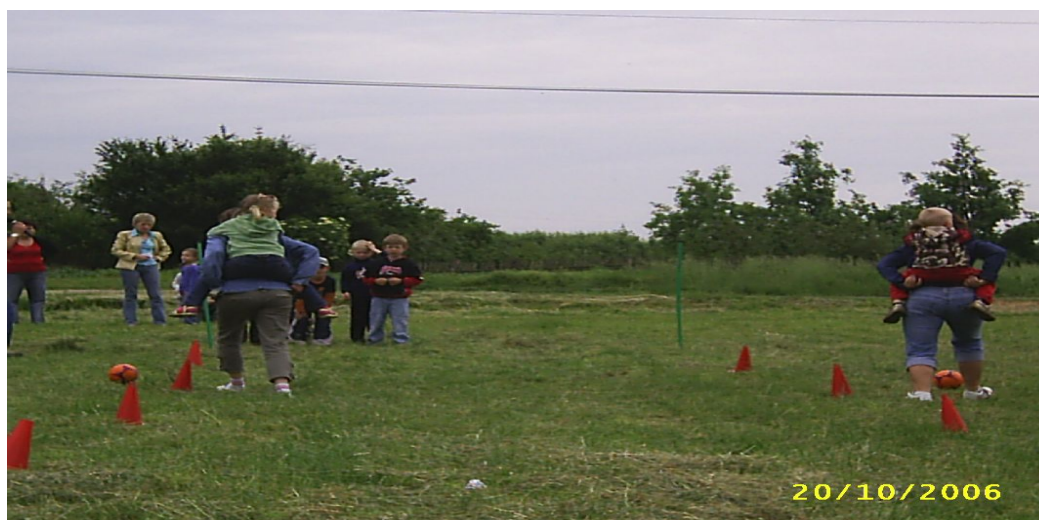
Fot. 6. Dzień Dziecka