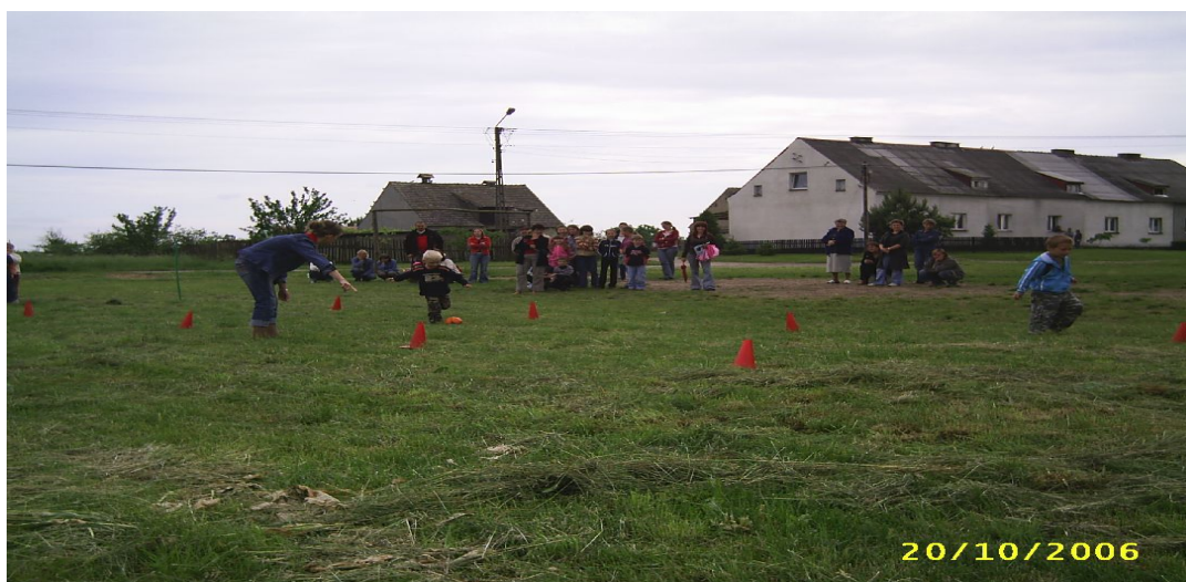
Fot. 5. Dzień Dziecka