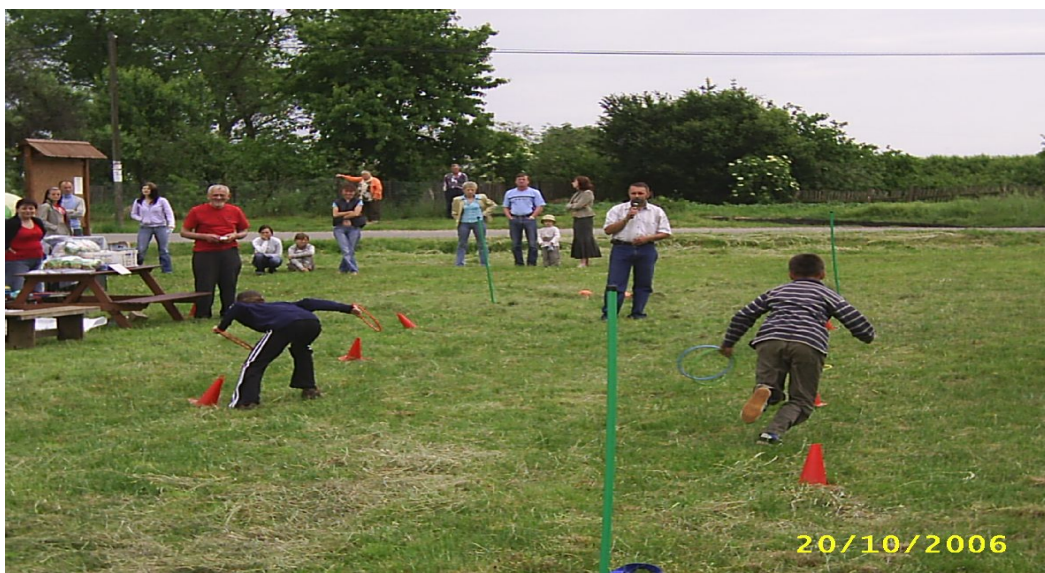
Fot. 7. Dzień Dziecka