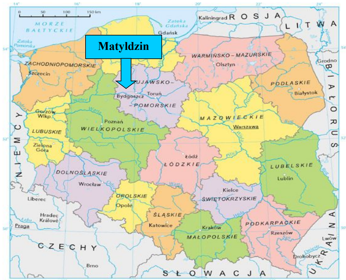
Mapa 1. Położenie Matyldzina na tle kraju i województwa