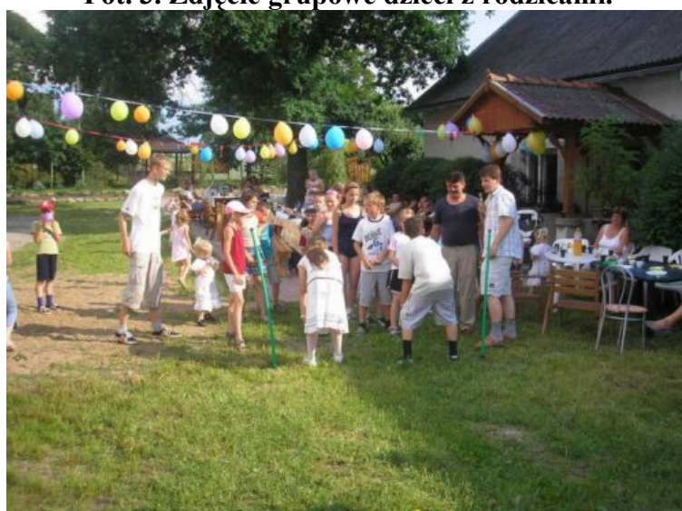
Fot. 4. Gry i zabawy dla dzieci