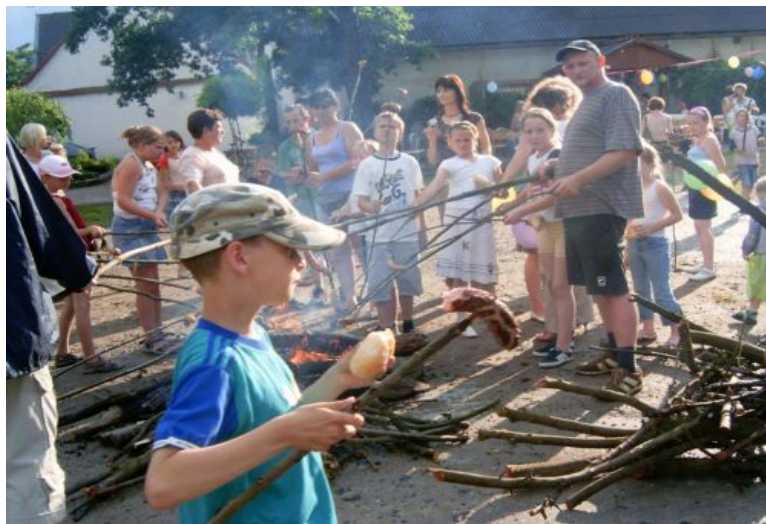
Fot. 6. Wspólne ognisko dla dzieci i rodziców