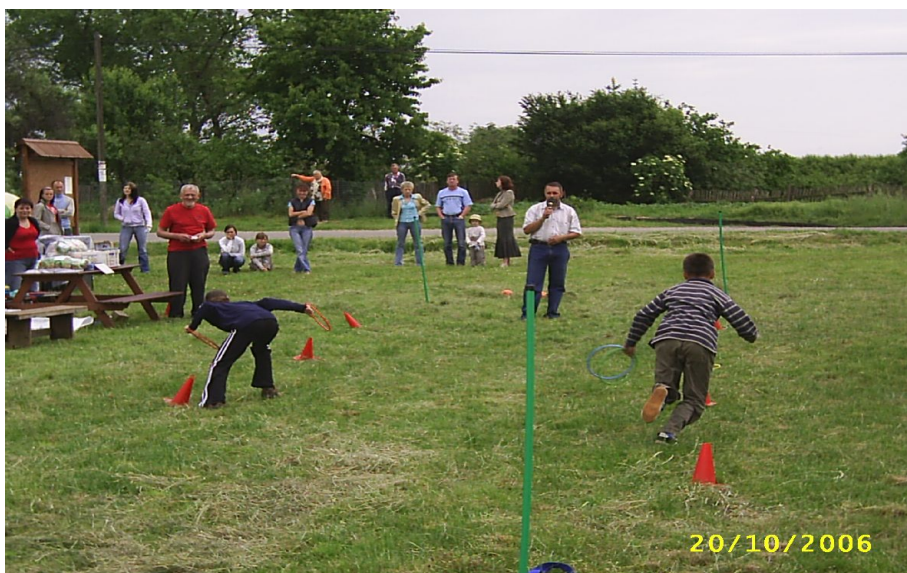
Fot. 7. Dzień Dziecka