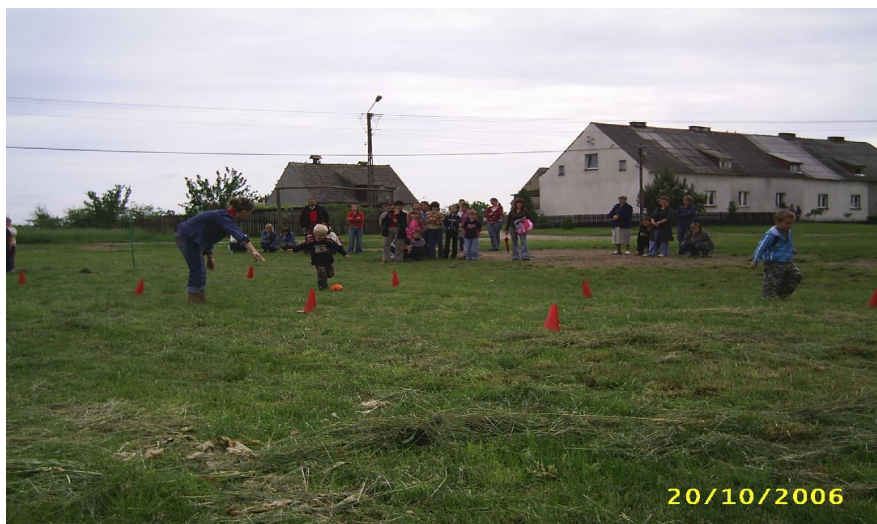
Fot. 5. Dzień Dziecka