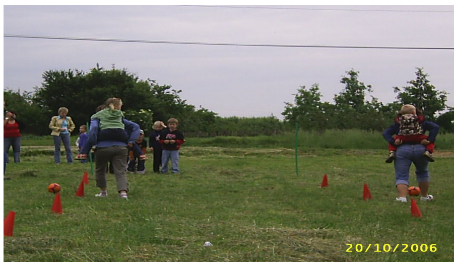
Fot. 6. Dzień Dziecka