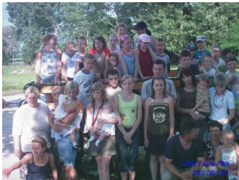
Fot. 3. Zdjęcie grupowe dzieci z rodzicami.