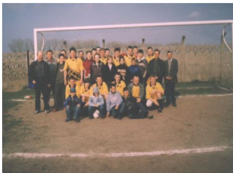
Fot. 12 Młodzi piłkarze wraz z ojcami

Jednak to nie zniechęcało drużyny, która składała się głównie z bardzo młodych chłopaków i ich ojców. Oni grali dla zabawy i wspólnie spędzonych wolnych chwil. Czasem jednak i to się zmieniło. Wielu starszych już zawodników rezygnowało z gry jednak byli inni młodzi i chętni do zabawy. Młoda drużyna po pewnym czasie nabrała doświadczenia i powoli zaczęła odnosić sukcesy, by w sezonie 2006/2007 r. zdobyć tytuł lidera ligi i cieszyć się z takiego tryumfu.