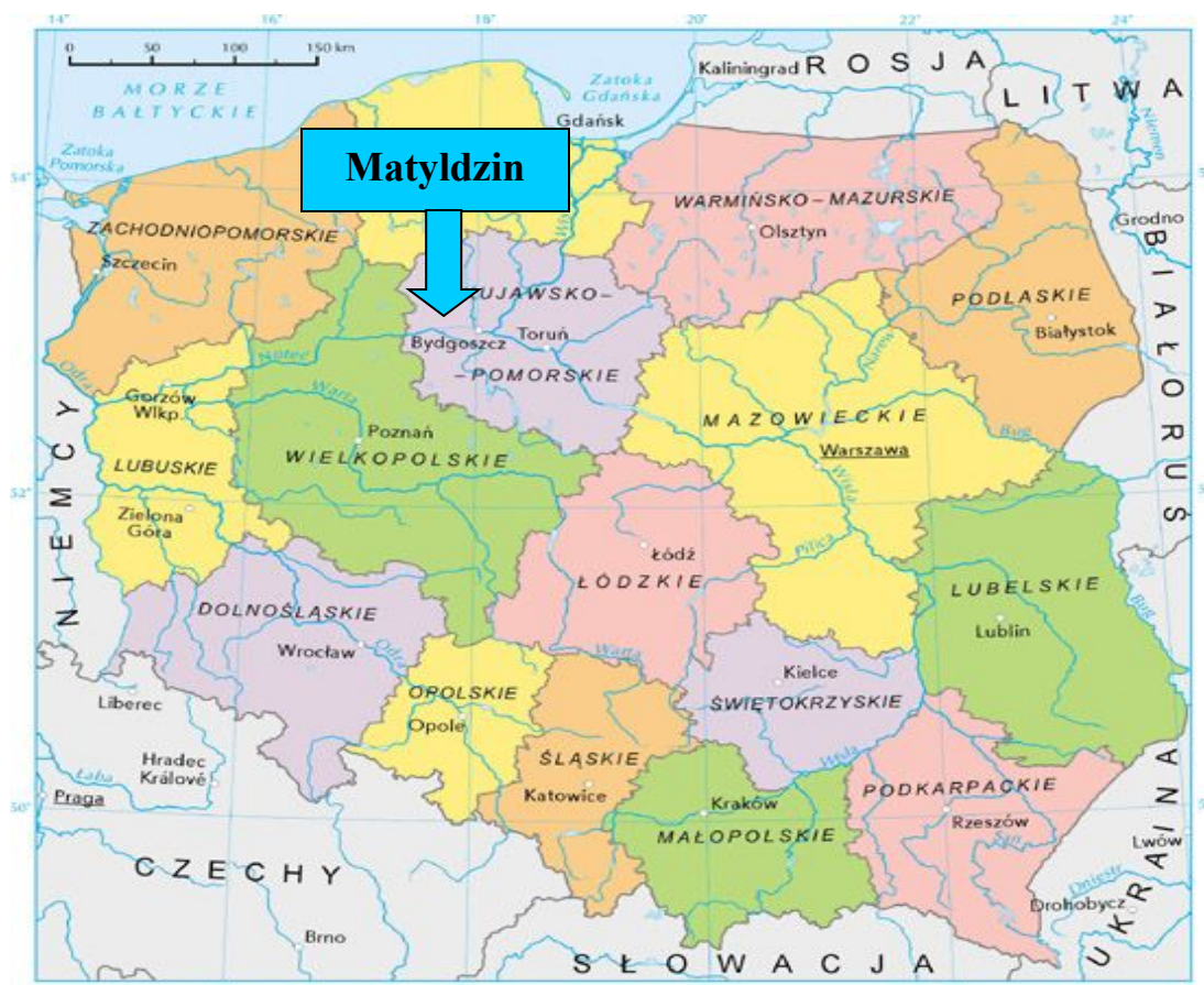
Mapa 1. Położenie Matyldzina na tle kraju i województwa

Matyldzin położony jest w województwie kujawsko-pomorskim, powiecie nakielskim w południowo - zachodniej części gminy Mrocza. Graniczy z sołectwem Wyrza, Białowieża, Kaźmierzewo i Krukówko.