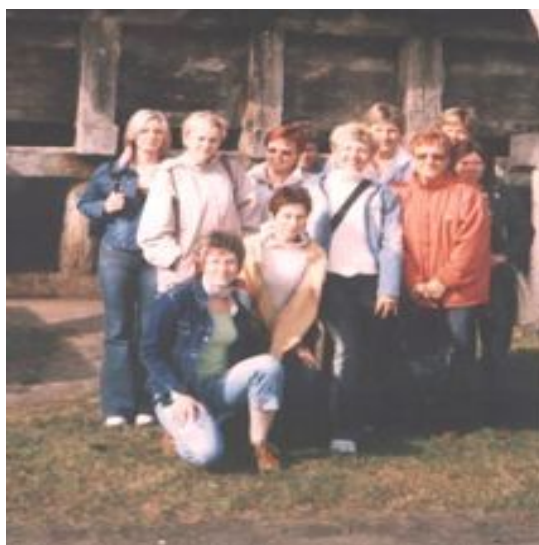
Fot. 11 Zdjęcie z wycieczki do Ciechocinka

Koło Gospodyń Wiejskich w Matyldzinie, zostało założone w dniu 27.01.2003 r.. Koło liczy 14 osób. Panie z koła gospodyń organizują spotkania opłatkowe, noworoczne, Dzień Kobiet, Dzień Dziecka, grill. Organizują wycieczki, uczestniczą w imprezach takich jak Rościminiada, Dożynki Gminne.