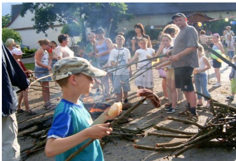
Fot. 6. Wspólne ognisko dla dzieci i rodziców