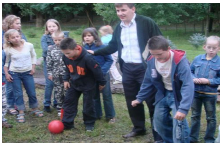
Fot. 10. Gry i zabawy dla dzieci