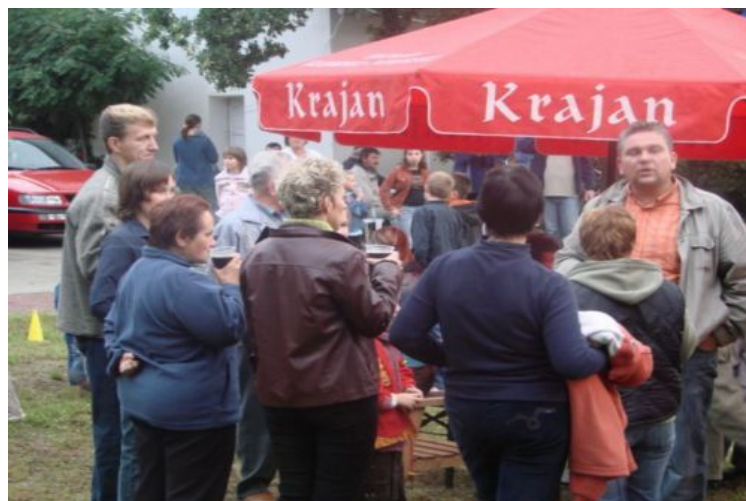
Fot. 7.8.9. Mieszkańcy wsi