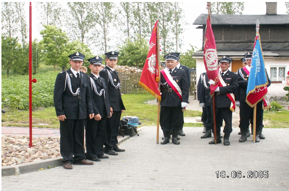
Fot. 3. Otwarcie remizy w Kosowie, czerwiec 2005r.