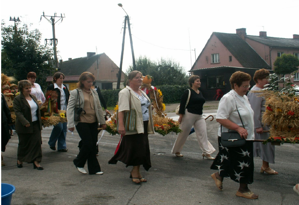
Fot.1. Dożynki Gminne w Witosławiu