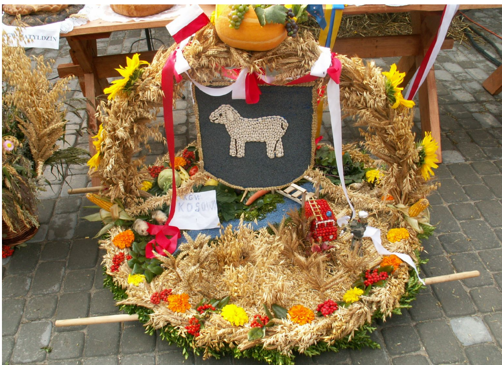
Fot. 2. Dożynki Gminne w Witosławiu – wieniec Kosowa