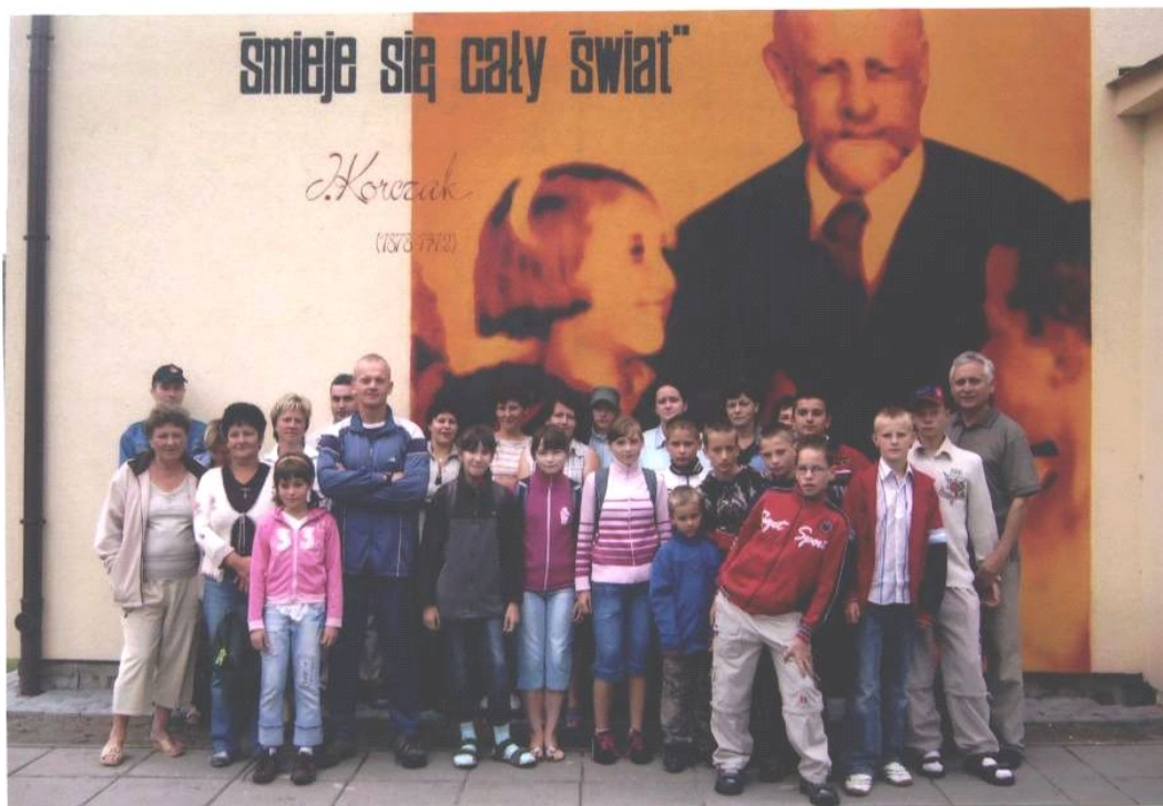
Fot. 6, 7. Niepubliczna Szkoła Podstawowa w Kosowie