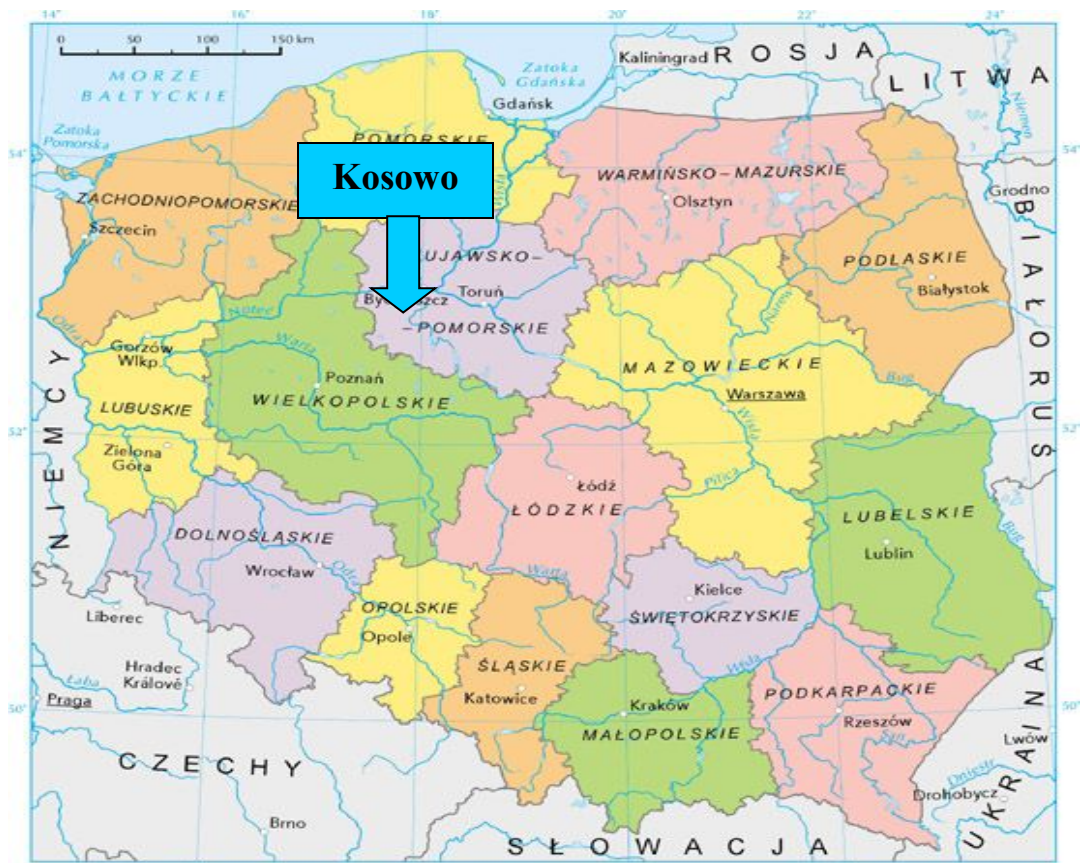
Mapa 1. Położenie Kosowa na tle kraju i województwa.