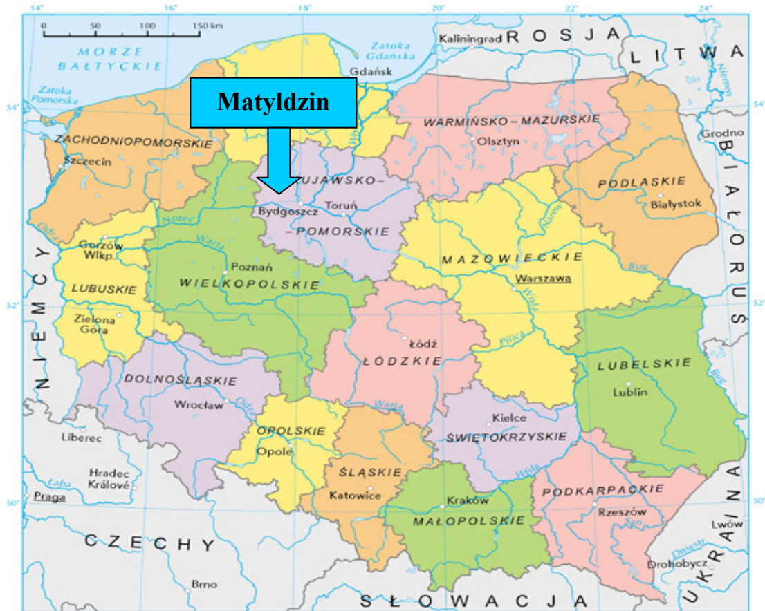
Mapa 1. Położenie Matyldzina na tle kraju i województwa

Matyldzin położony jest w województwie kujawsko-pomorskim, powiecie nakielskim w południowo - zachodniej części gminy Mrocza. Graniczy z sołectwem Wyrza, Białowieża, Kaźmierzewo i Krukówko.