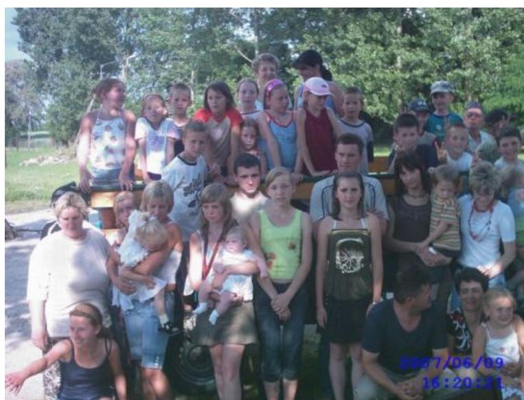
Fot. 3. Zdjęcie grupowe dzieci z rodzicami.