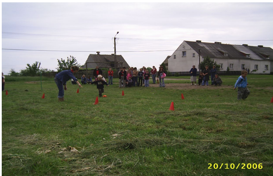
Fot. 5. Dzień Dziecka