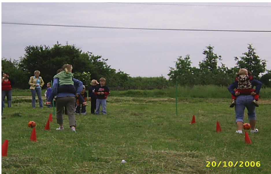
Fot. 6. Dzień Dziecka