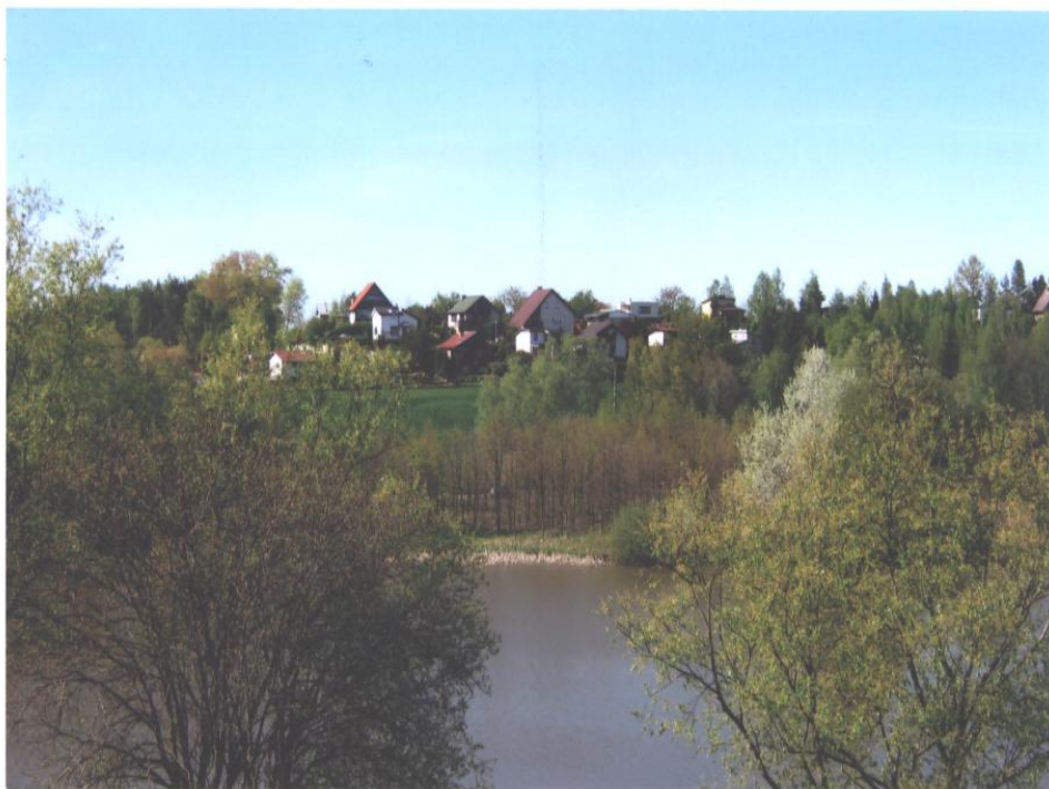
Fot.3, 4. Ogródki działkowe