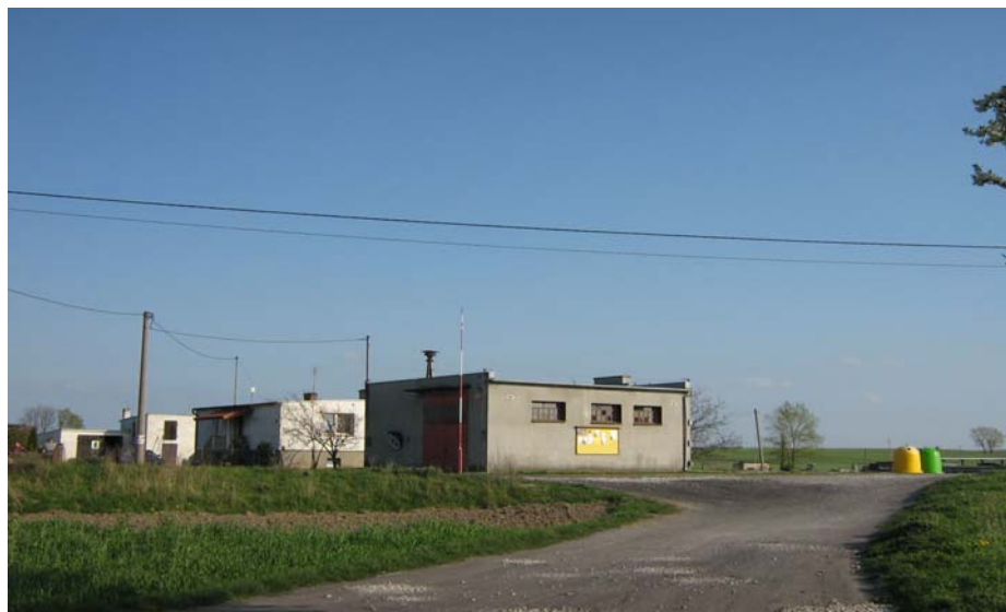
Fot. 15. Remiza OSP

We wsi działa Ochotnicza Straż Pożarna, która aktywnie uczestniczy w życiu społeczności wiejskiej. Ponadto odnosi sukcesy w zawodach strażackich zarówno gminnych, jak i powiatowych.