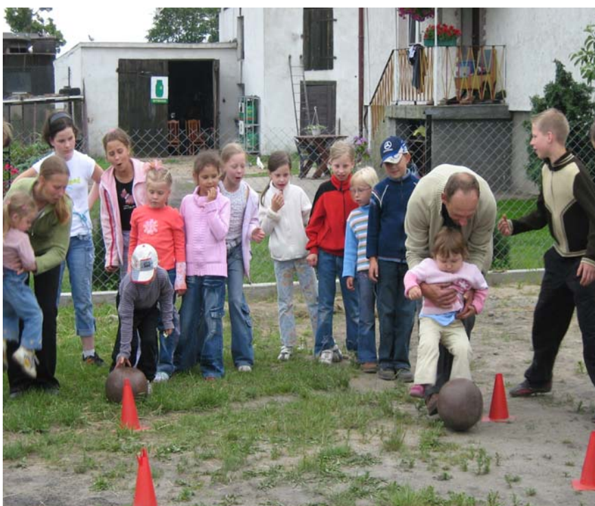
Fot. 8,9. Dzień Dziecka organizowany corocznie „pod chmurką”.

Mieszkańcy czynnie włączają się w organizowanie Dożynek Parafialnych. Tradycją jest wykonywanie wieńców dożynkowych. Na pikniku dożynkowym mieszkańcy promują swoją wieś poprzez między innymi organizowanie stoiska , gdzie można poczęstować się wypiekami.