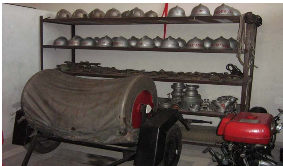
Fot.16. Budynek Remizy OSP