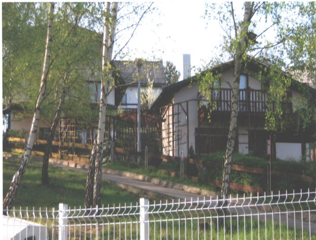
Fot. 5,6. Ogródki działkowe „Pod Dąbrówką”