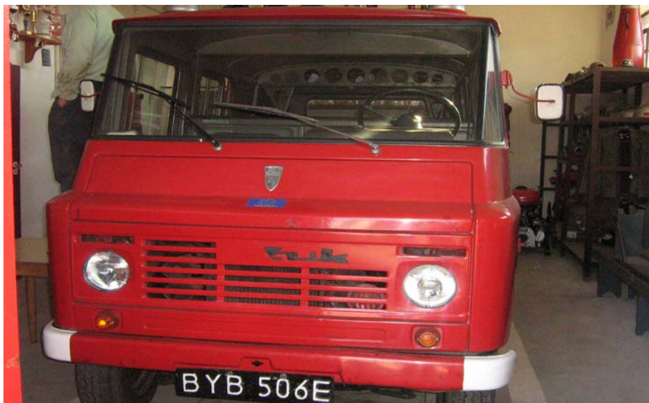
Fot. 18. Samochód OSP