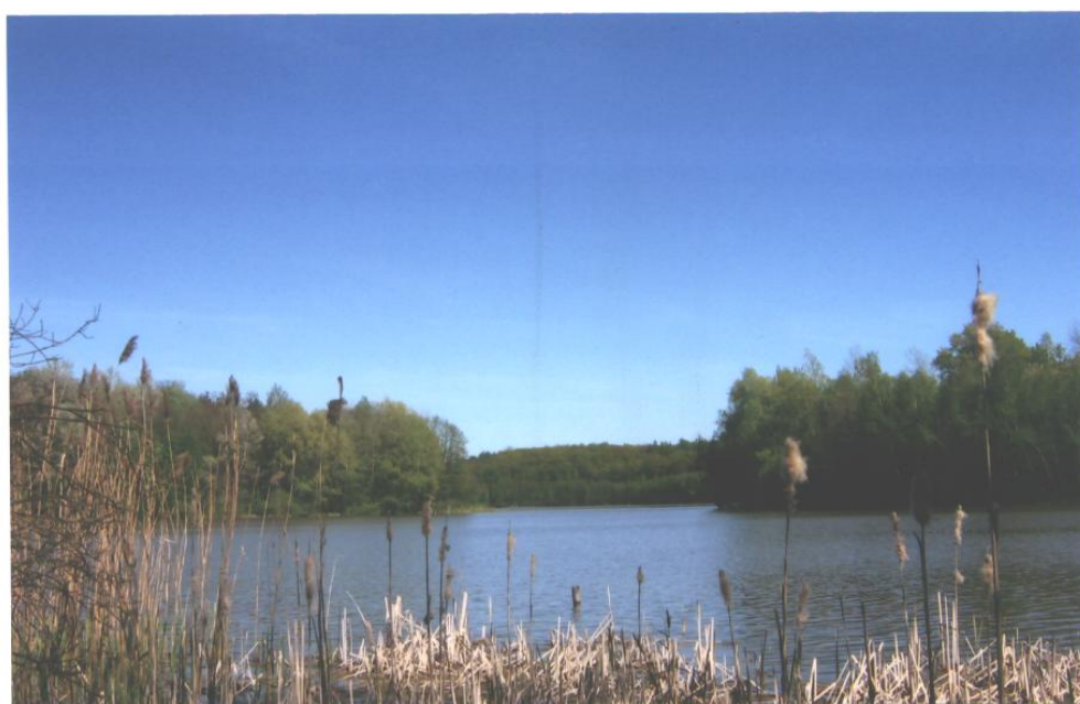
Fot.1, 2. Jezioro Dębe