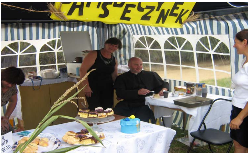
Fot. 10, 11, 12. Dożynki Parafialne