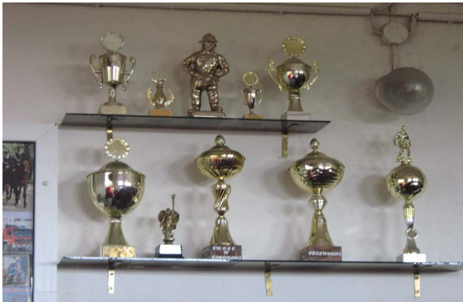
Fot. 17. Remiza OSP