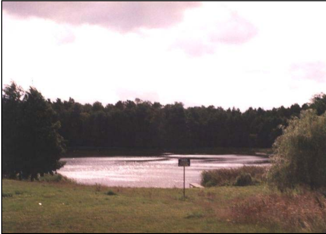
Jezioro Rościmińskie Małe