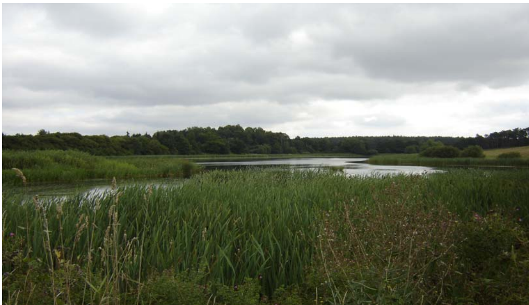
Jezioro Rościmińskie Duże