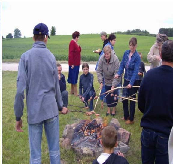
Fot.6. Wspólne ognisko

Mieszkańcy Kaźmierzewo biorą corocznie udział w Dożynkach Gminnych organizowanych w Witosławiu, na które przygotowują wieniec oraz chleb.