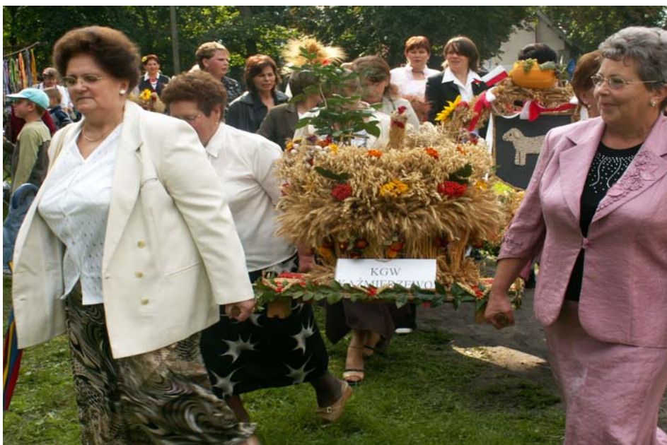
Fot. 7. Dożynki Gminne w Witosławiu

Mieszkańcy Kaźmierzewo biorą corocznie udział w Dożynkach Gminnych organizowanych w Witosławiu, na które przygotowują wieniec oraz chleb.