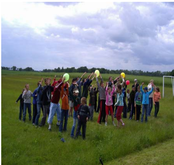
Fot. 5. Dzień Dziecka

Mieszkańcy miejscowości Kaźmierzewo, głównie aktywnie działające Koło Gospodyń Wiejskich oraz rada sołecka organizują różne imprezy okolicznościowe, m.in. Dzień Babci, Dzień Dziadka, Dzień Kobiet, Dzień Matki, Dzień Dziecka, Mikołajki, dożynki sołeckie, zabawy karnawałowe.