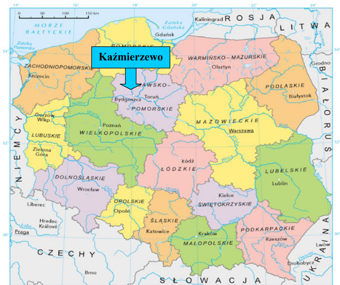
Mapa 1. Położenie Kaźmierzewa na tle kraju i województwa.

Miejscowość Kaźmierzewo położona jest w województwie kujawsko-pomorskim, powiecie nakielskim, w zachodnio - południowej części gminy Mrocza. Graniczy z takimi sołectwami jak: Witosław i Izabela oraz gminą Sadki.