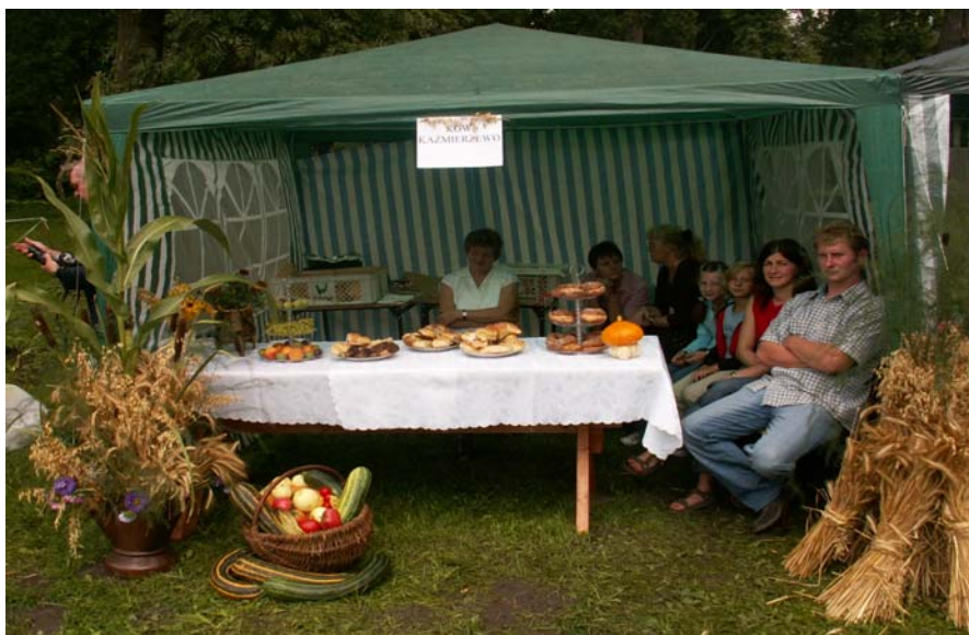
Fot. 9. Dożynki Gminne w Witosławiu, stoisko Kaźmierzewa