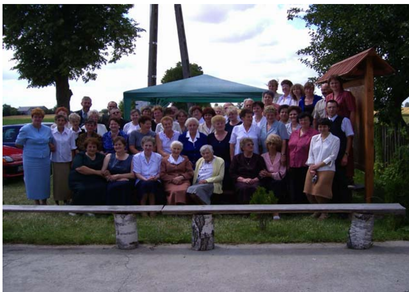
Fot. 18. Obchody 40 –lecia KGW w Kaźmierzewie