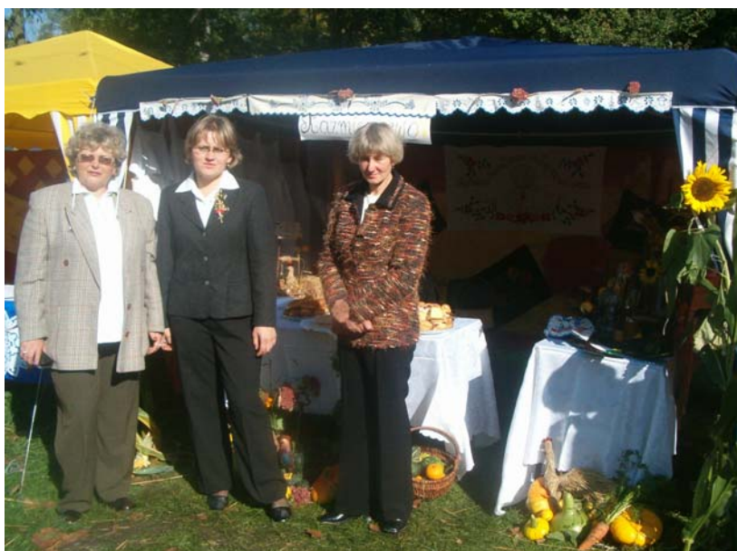
Fot. 19. Panie z KGW w Kaźmierzewie przy swoim stoisku