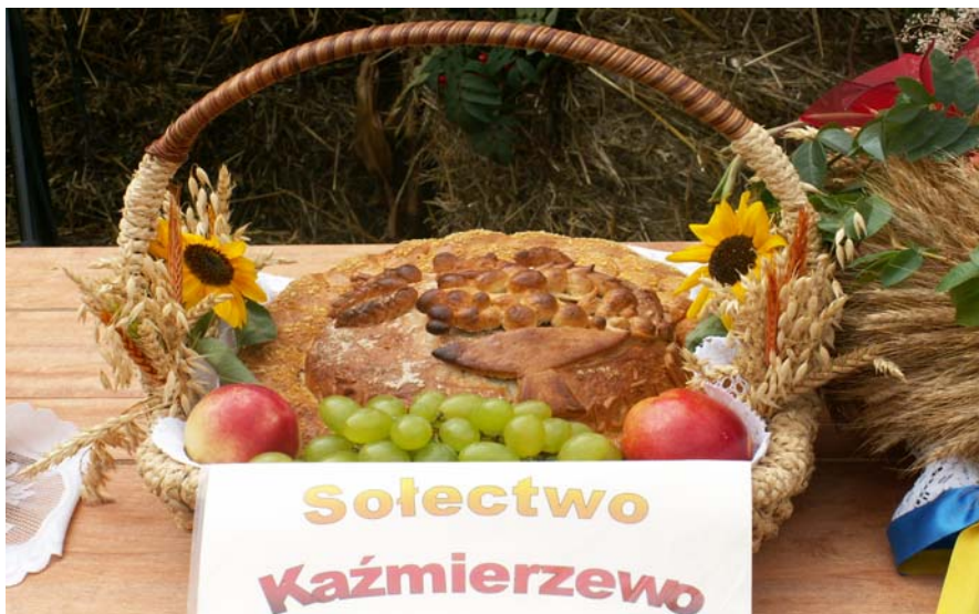
Fot. 8. Dożynki Gminne w Witosławiu, chleb dożynkowy sołectwa Kaźmierzewo