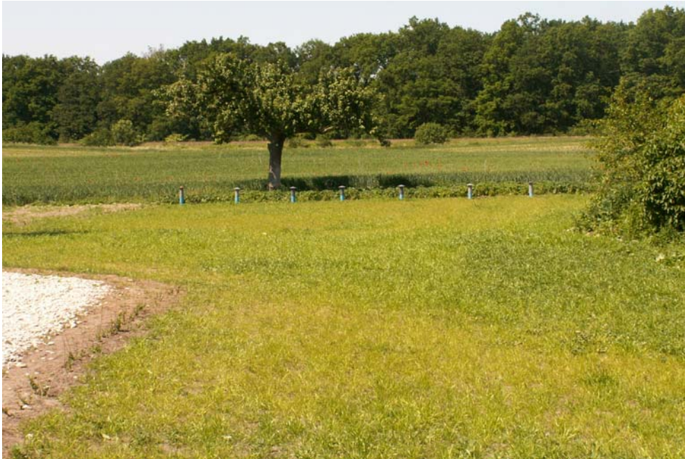
Fot. 1. Wiejski krajobraz Kaźmierzewo