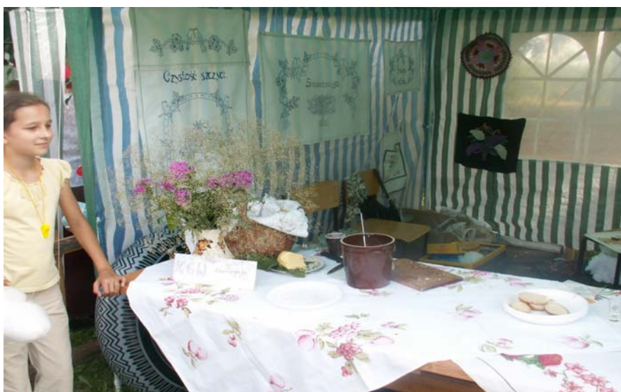
Fot.10. Udział w „Impresjach Witosławskich” – stoisko Kaźmierzewa