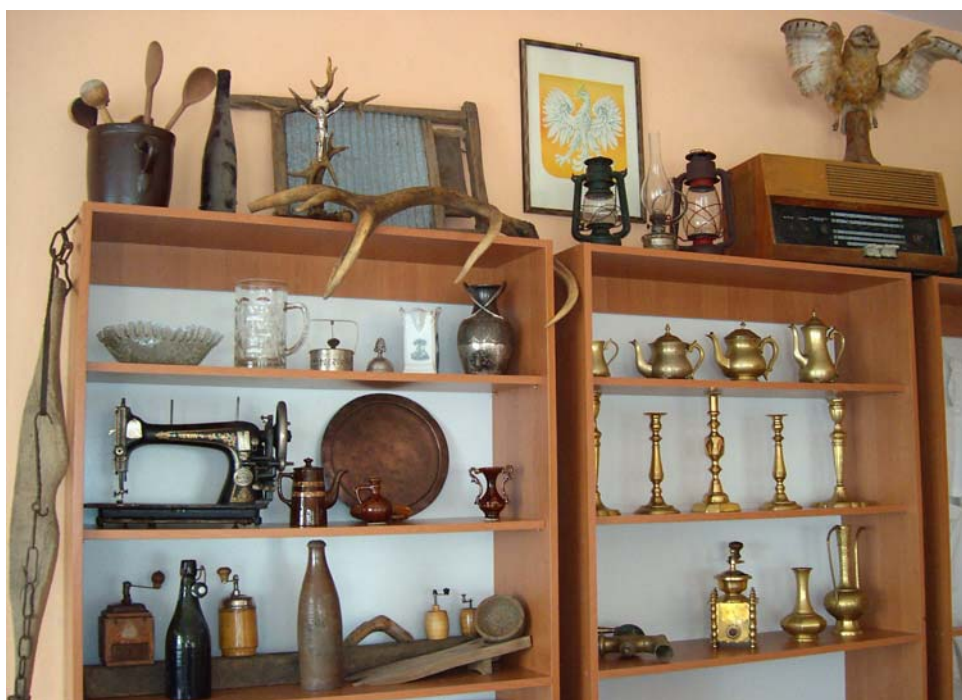
Fot.4. Izba tradycji wiejskich w świetlicy wiejskiej w Kaźmierzewie