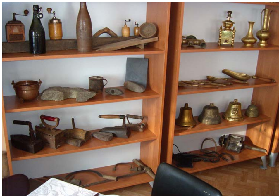
Fot.3. Izba tradycji wiejskich w świetlicy wiejskiej w Kaźmierzewie