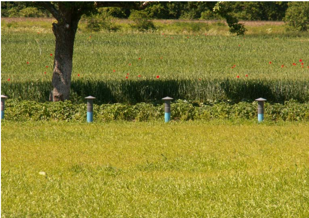
Fot. 2. Wiejski krajobraz – pola wsi Kaźmierzewo