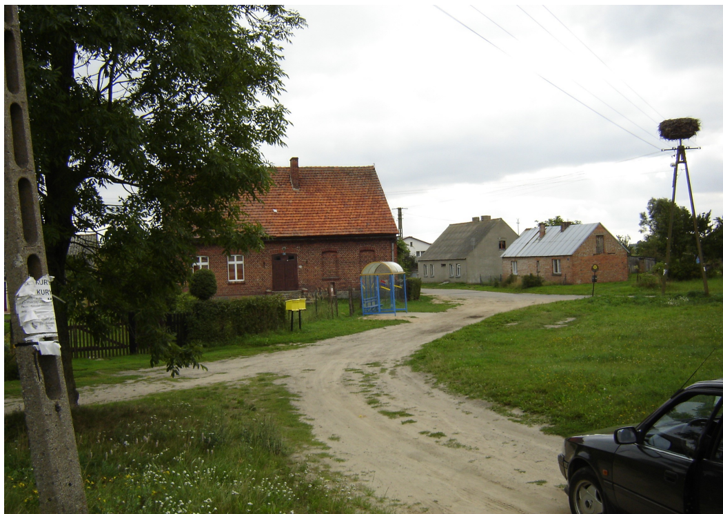
Fot. 2. Budynek świetlicy wiejskiej oraz wiata przystankowa