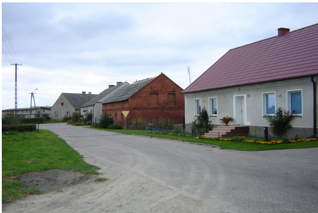
Fot.1. Jeziorki Zabartowskie – zabudowania