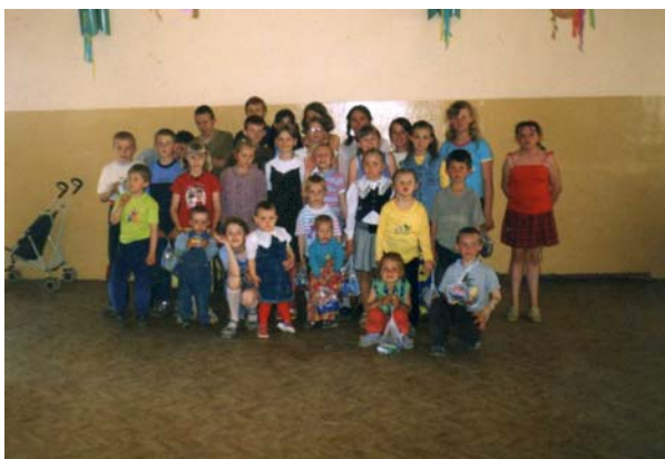
Fot.6 Dzień Dziecka