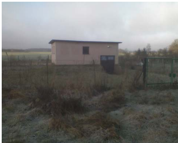
Fot. 9 Budynek hydroforni