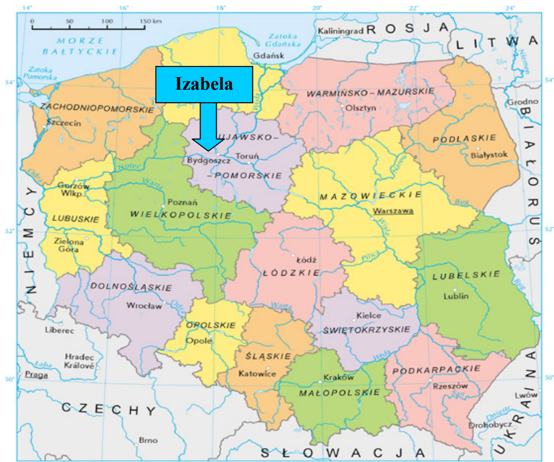
Mapa 1. Położenie Izabeli na tle kraju i województwa.