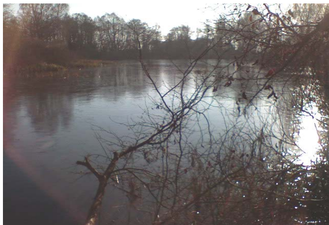
Fot.2 Stawy i rozlewiska.