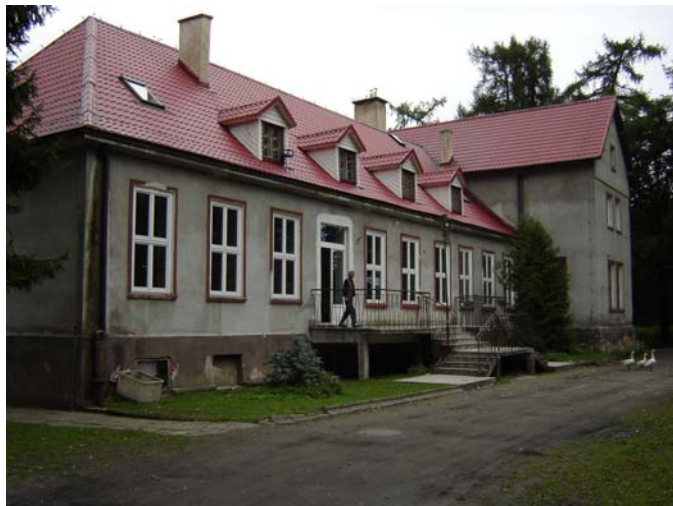
Fot. 3 Budynek po byłym Ośrodku Szkoleniowo-Wychowawczym.