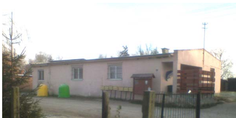
Fot.7 Świetlica wiejska