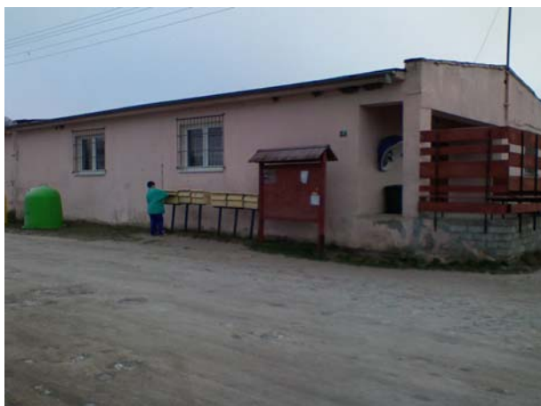
Fot. 10 Sklep spożywczy.