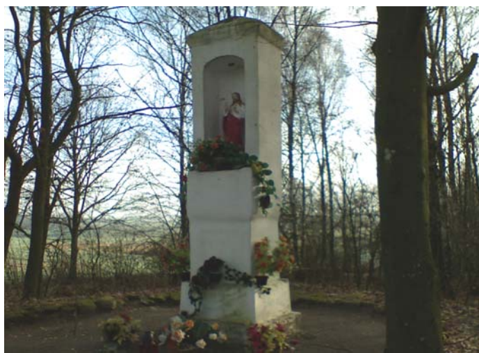
Fot. 4. Figura Pana Jezusa