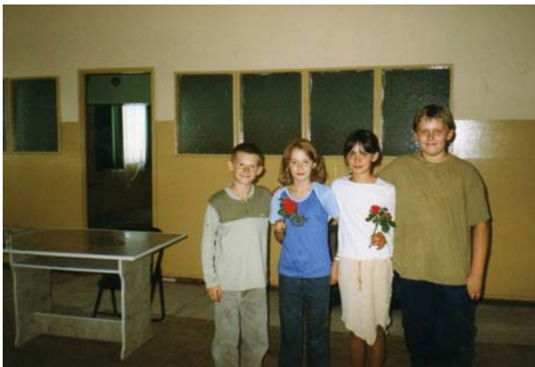
Fot. 5 Dzień Kobiet i Dzień Matki