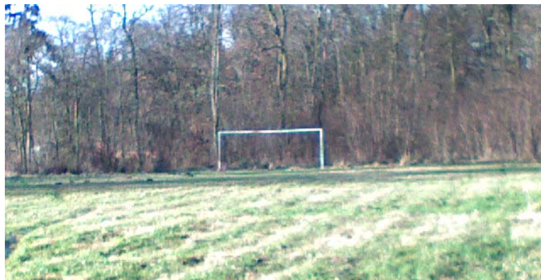
Fot. 8 Boisko sportowe