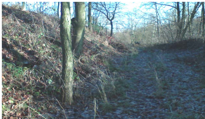
Fot.1 Dzikie szlaki turystyczne,