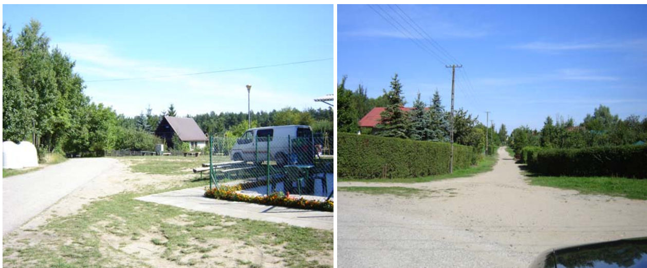
Fot. 6. Ogródki działkowe

W Drzewianowie znajdują się działki budowlane pod zabudowę mieszkaniową oraz mieszkania na sprzedaż w budynku dawnej szkoły. Ważnym elementem naszego letniego krajobrazu są działkowcy, którzy przybywają latem do swoich domków letniskowych. Wówczas to mieszkańcy wsi uczestniczą w imprezach plenerowych nad jeziorem i vice versa. We wsi nie znajdują się żadne tradycyjne obiekty gospodarskie, takie jak np. spichlerze, kuźnie czy młyny, ale spora część domów mieszkalnych ma ponad 100-letnią historię. Ważnym miejscem w centrum jest świetlica wiejska i teren do niej przyległy. To tu odbywają się wszystkie ważne imprezy i zebrania wiejskie. Natomiast dzieci wolą spotykać się na boisku, tu mogą pograć w piłkę i pobiegać.