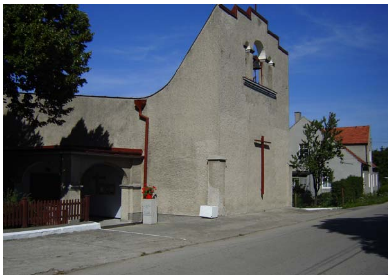
Fot. 4. Kościół parafialny pw. św. Anny w Drzewianowie