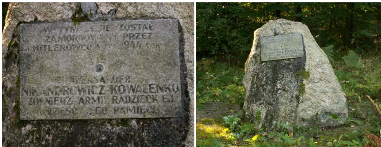
Fot. 3. Kamień upamiętniający śmierć Żołnierza Armii Radzieckiej – Aleksandra Kowalenki

Wieś Drzewianowo cechuje się zwartą zabudową przestrzenną, tzn. posesje mieszczą się przy głównej drodze biegnącej przez wieś. Na terenie wsi znajduje się zespół wiejski zbudowany na przełomie XIX/XX w. Znajduje się tu kościół parafialny pod wezwaniem św. Anny z 1903r. (przebudowany w 1978r.), cmentarz rzymsko-katolicki (parafialny), cmentarz ewangelicki (nieczynny), a także niedawno odnaleziono na jednej z posesji zabytkową figurę Matki Boskiej, która po renowacji znajdzie godne siebie miejsce. W pobliskim lesie znajduje się miejsce pamięci – Kamień upamiętniający śmierć Aleksandra Kowalenki – Żołnierza Armii Radzieckiej, ciało zostało pochowane na Cmentarzu Żołnierzy Armii Radzieckiej w Krukówce. Nasi strażacy są opiekunami sprawnej do dziś zabytkowej sikawki konnej z 1882r.