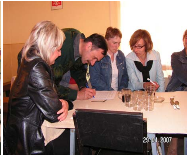
Fot. 10. Zebrania wiejskie