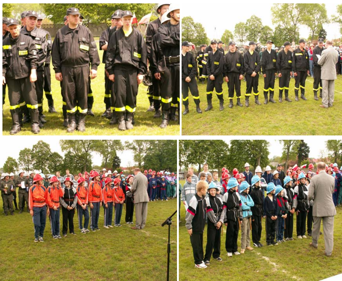
Fot. 9. Miejsko- Gminne Zawody Pożarnicze w Mroczy – drużyny OSP Drzewianowo

Niedawno - 29.04.2007r. zostało powołane do życia Stowarzyszenie Na Rzecz Rozwoju Wsi Drzewianowo. Jego założycielami są osoby, którym zależy na rozwoju wsi. Celem Stowarzyszenia jest szerzenie oświaty, organizacja kursów i szkoleń, aktywacja ludności wiejskiej, wspieranie działań społeczno-zawodowych kobiet, propagowanie dorobku kultury narodowej i kultywowanie tradycji lokalnej, współpraca z władzami samorządowymi województwa, powiatu, gminy i wsi w zakresie przygotowania i realizacji planów rozwoju infrastruktury i gospodarki wsi.