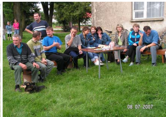
Fot. 5. Impreza integracyjna dla mieszkańców Drzewianowa