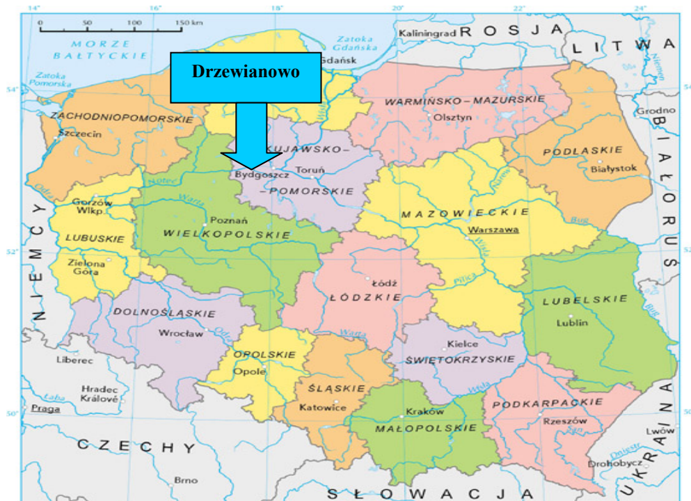
Mapa 1. Położenie Drzewianowa na tle kraju i województwa