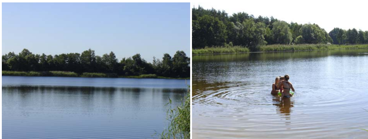
Fot. 2. Jezioro Słupowskie w Drzewianowie

W naszej miejscowości dominuje krajobraz wiejski-rolniczy. Jego walorami są czyste lasy, stanowiące ostoję zwierzyny a co za tym idzie rozległe tereny łowieckie. Miejscowość oraz tereny przyległe leżą w granicach Obszaru Chronionego Krajobrazu Jezior Byszewskich. Na obrzeżach wsi płynie rzeczka Krówka, a 1,5 km za wsią znajduje się piękne i rozległe Jezioro Słupowskie.