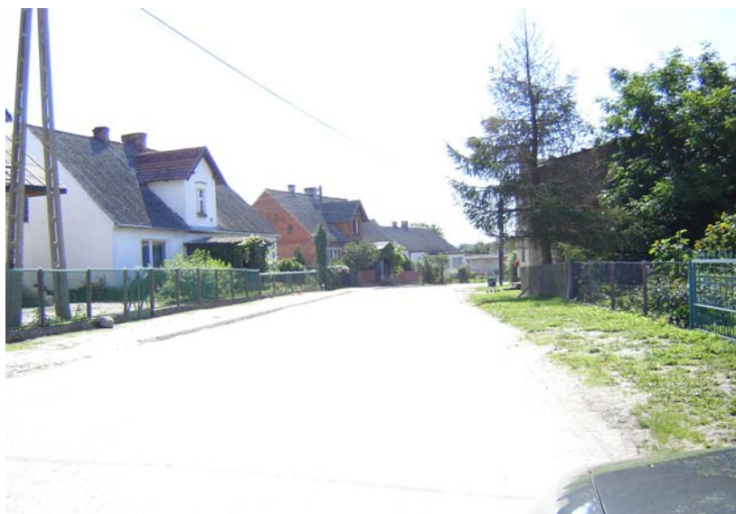
Fot. 1. Panorama wsi

Drzewianowo wzmiankowane w 1296r. posiada nazwę dzierżawczą od nazwiska Drzewian, prawdopodobnie założyciela osady. Wieś usytuowana przy drodze z Mroczy do Koronowa w parafii własnej od XIV do XV w., później mroteckiej, obecnie Parafia św. Anny w Drzewianowie. Dzisiejsze przysiółki: Wybudowanie Drzewianowo.