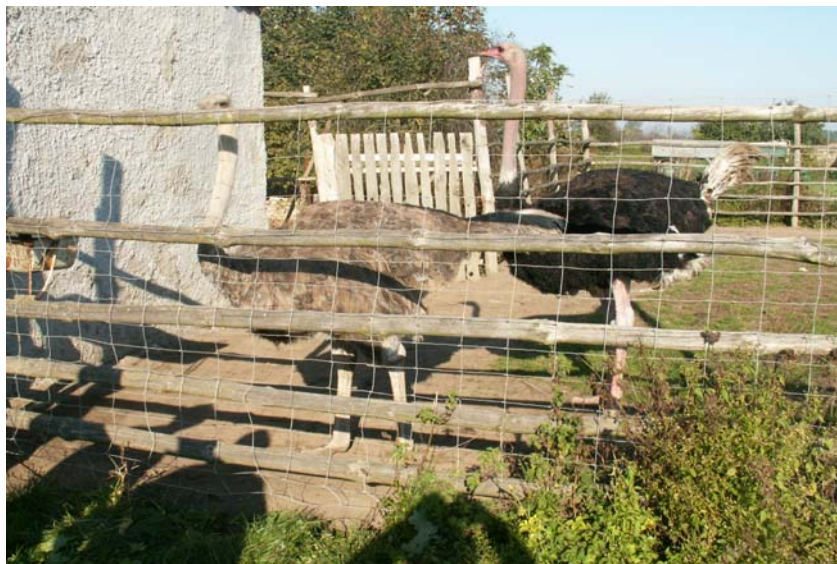
Fot. 7. Ferma strusiów w Drzewianowie