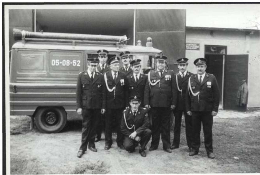
Fot. 8. OSP Drzewianowo