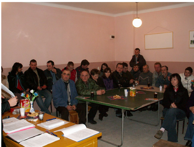
Fot.17. Zebranie sołeckie w Drażnie.