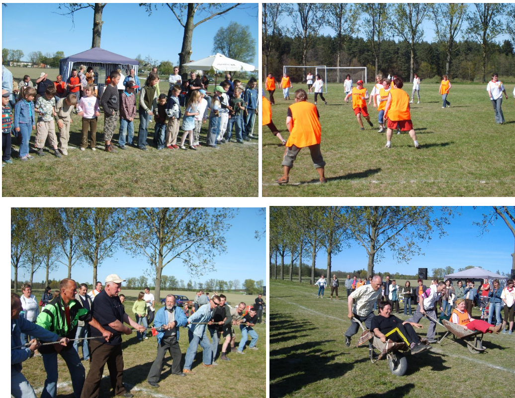
Fot. 12. Majówka w Drażnie.