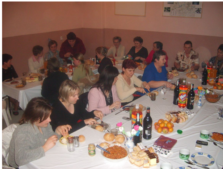
Fot. 11. Dzień Kobiet w świetlicy wiejskiej w Drażnie.