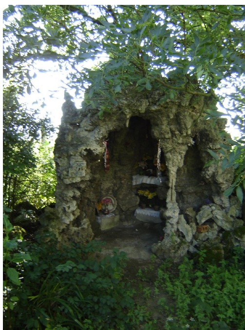
Fot.7. Grota – w przeszłości było to miejsce odprawiania nabożeństwa majowego w Drażnie.