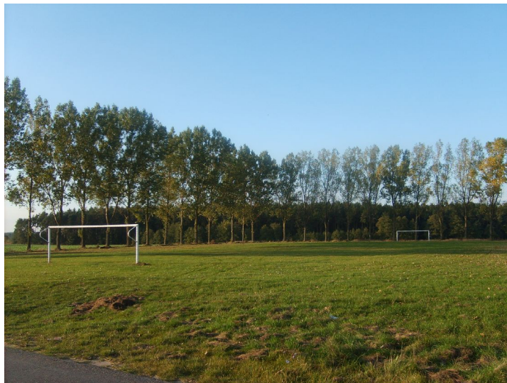
Fot.15. Boisko sportowe w Drażnie.

Na terenie Drażna znajduje się boisko sportowe (niedoposażone – stare siatki na bramki, brak ławek dla kibiców, brak specjalnie wydzielonych miejsc dla zawodników, brak zaplecza technicznego na sprzęt i stroje sportowe, brak kosiarki, brak miejsc parkingowych, itp.).