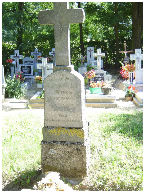
Fot. 8. Cmentarz rzymsko-katolicki w Dąźnie.