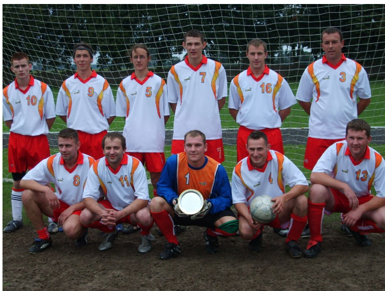
Fot. 16. Drużyna Piłkarska „Płomień Drażno”.