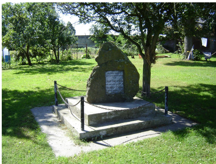
Fot. 6. Pomnik Powstańca Wielkopolskiego – Józefa Balcerzaka.