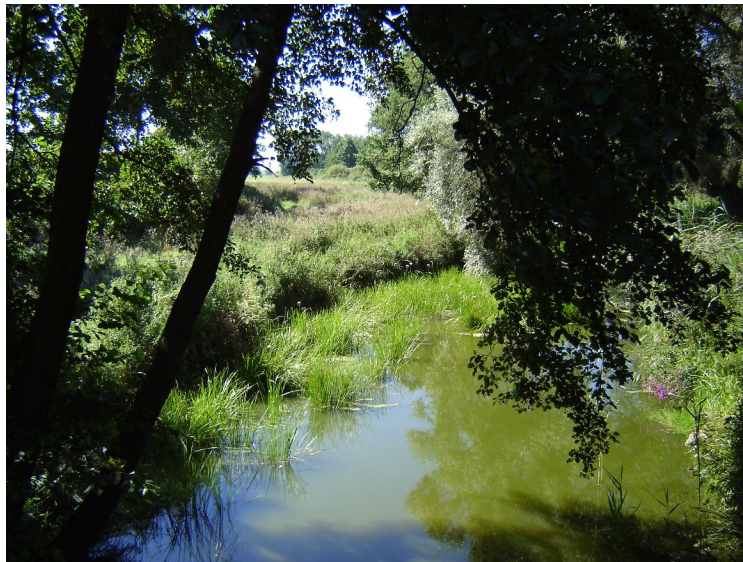
Fot. 4. Rzeką Rokitka.