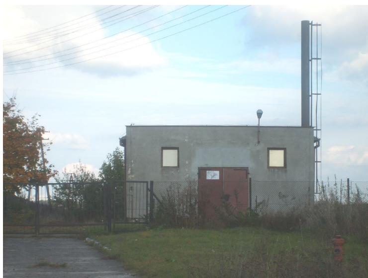
Fot.14. Budynek hydroforni w Drażnie, który w najbliższym czasie ma być adoptowany na świetlicę wiejską i remizę OSP w Drażnie.

W Drażnie nie ma świetlice, obecnie miejscem spotkań jest zastępcza świetlica, która stanowi wydzielone pomieszczenie z jednej klasy po byłej Szkole Podstawowej w Drażnie. Świetlica ta nie spełnia oczekiwań mieszkańców, ponieważ sala jest mała, jest niewyposażona (brak stolików, krzeseł, materiałów edukacyjnych oraz materiałów do gry i zabawy), brak zaplecza kuchennego i toalet. Jest to świetlica na okres tymczasowy do momentu podłączenia miejscowości do gminnej sieci wodociągowej. Działanie to umożliwi zamknięcie byłej hydroforni oraz przeprowadzenie prac adaptacyjnych budynku na świetlicę wiejską i remizę OSP.