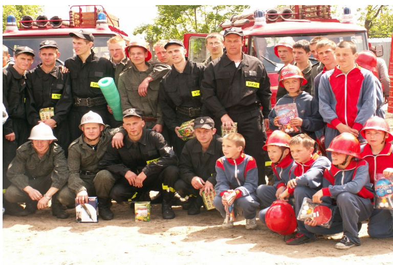
Fot.15. OSP Drażno na Gminnych Zawodach Sportowo-Pożarniczych.