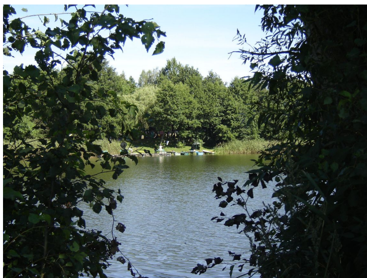
Fot. 2. Jezioro Drażno.