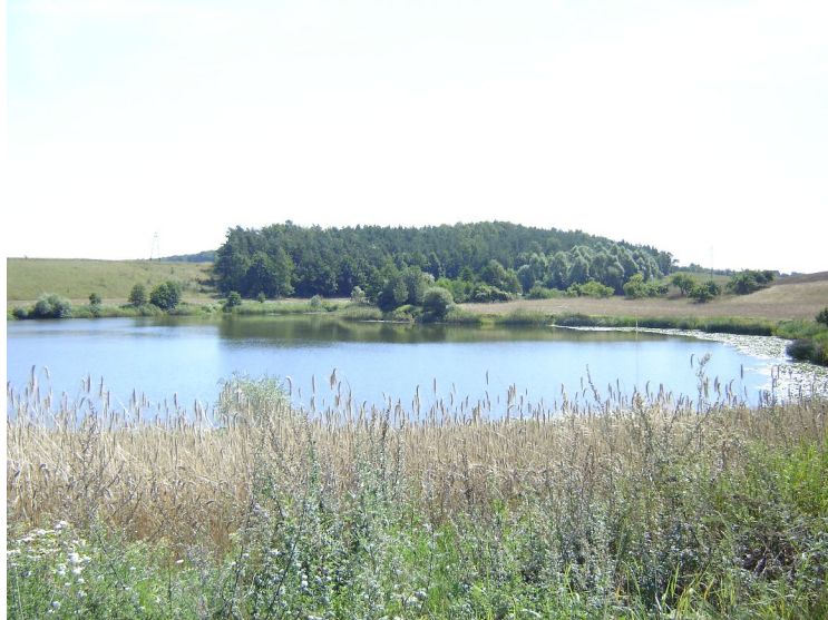
Fot.3. Jezioro Sianka.