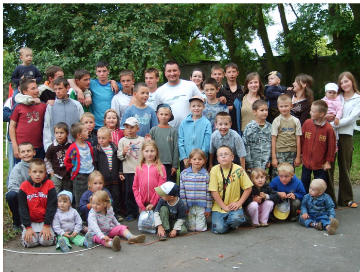
Fot. 13. Dzień Dziecka w Drażnie.