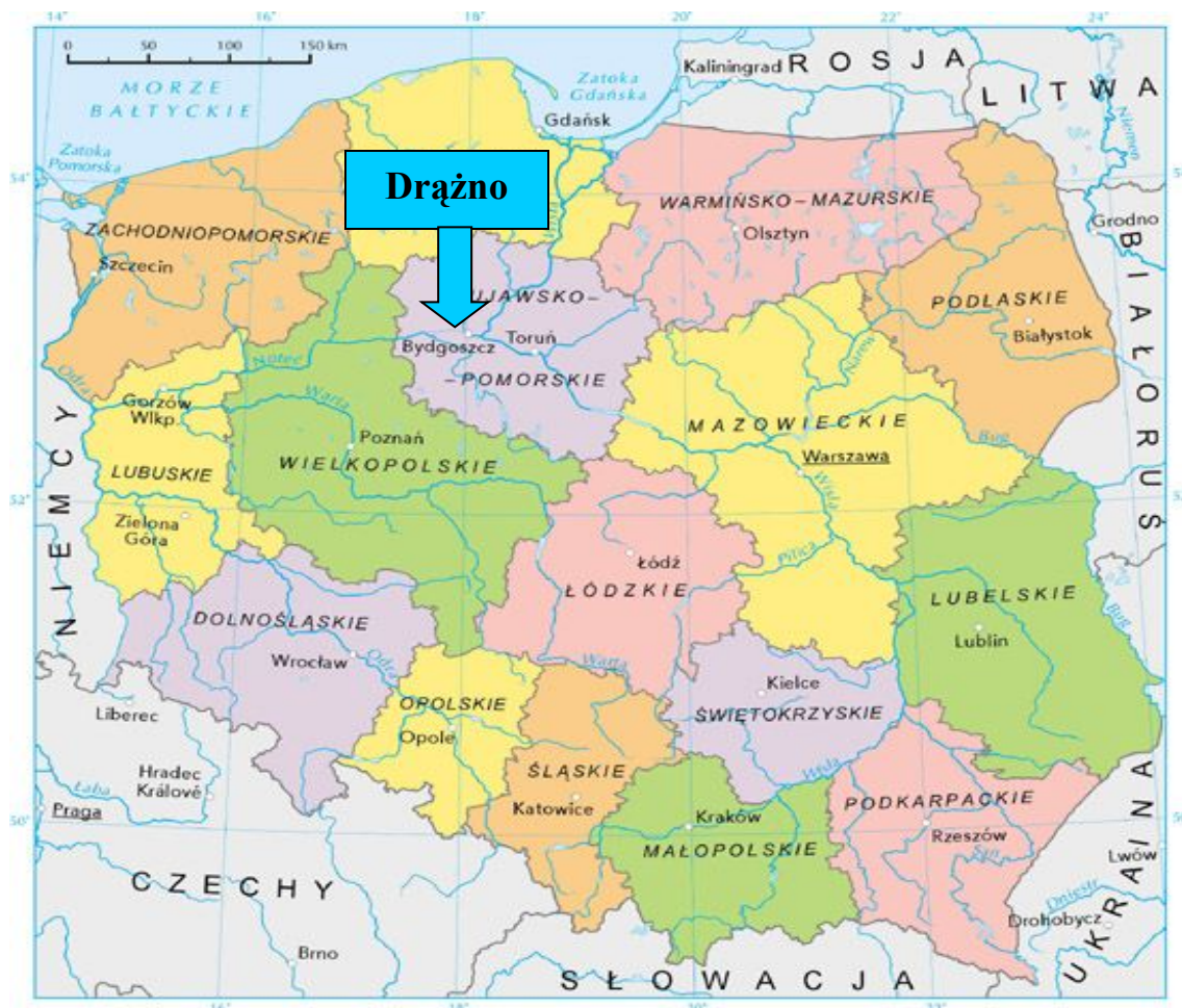
Mapa 1. Położenie Drażna na tle kraju i województwa.

Miejscowość Drażno położone jest w województwie kujawsko-pomorskim, powiecie nakielskim, w Pd.-Wsch. części gminy Mrocza, jest to wieś sołecka w skład, którego wchodzi miejscowość Drażno i Drażonek. Graniczy z takimi sołectwami jak: Kosowo, Krukówko, Ostrowo i Samsiecznynek, natomiast Pd. granica sołectwa Drażno stanowi granicę między gminą Mrocza a gminą Nakło.