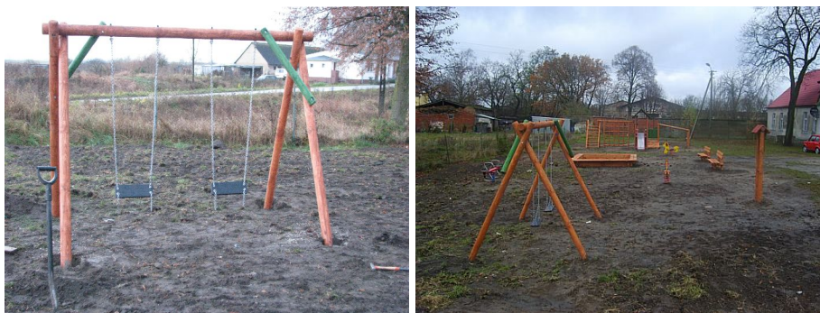
Fot. 16. Plac zabaw w Drążnie

Obecnie na terenie miejscowości nie ma działek pod budownictwo jednorodzinne, co w negatywny sposób wpływa na rozwój wsi i może spowodować, iż mieszkańcami tego terenu zostaną ludzie w starszym wieku, ponieważ młodzi wyprowadzą się z uwagi na brak możliwości zamieszkania we własnych prywatnych domach/mieszkaniach. Należy również zwrócić uwagę, iż rośnie zainteresowanie osiedlaniem się na terenach wiejskich w niedalekiej odległości od dużych miast a Drążno doskonale spełnia te warunki.