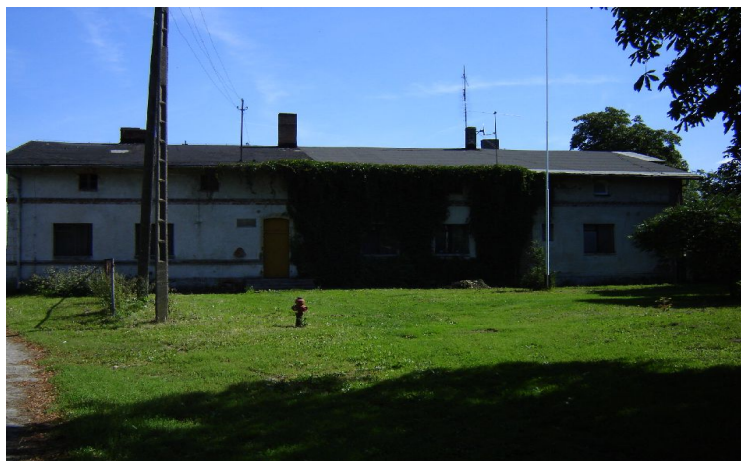
Fot.5. Pozostałości zespołu folwarcznego w Drażnie.