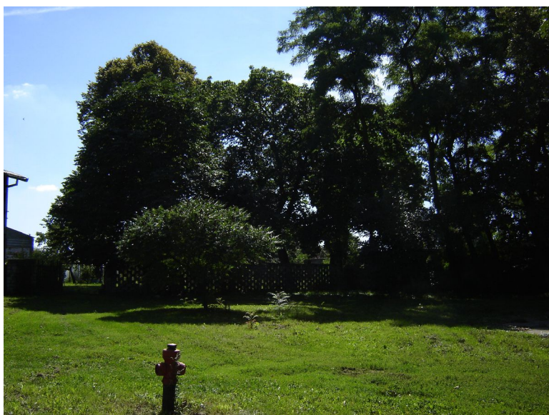
Fot. 1. Pozostałości parku podworskiego w Drażnie.