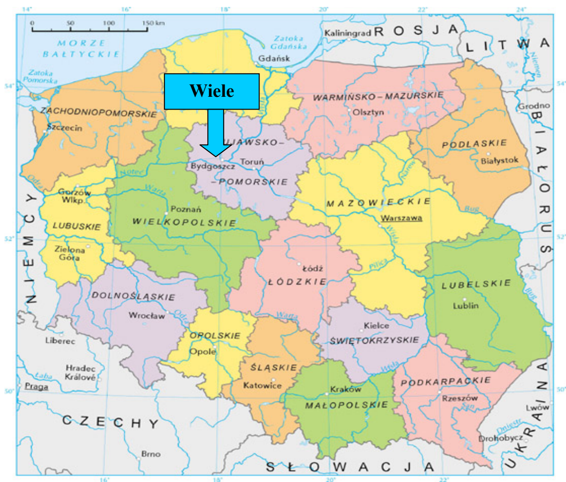
Mapa 1. Położenie miejscowości Viele na tle kraju i województwa.

Wiele położone jest w województwie kujawsko-pomorskim, powiecie nakielskim, w gminie Mrocza. Graniczy z sołectwami: Białowieża, Rościmin, Drzewianowo oraz z miastem Mrocza.