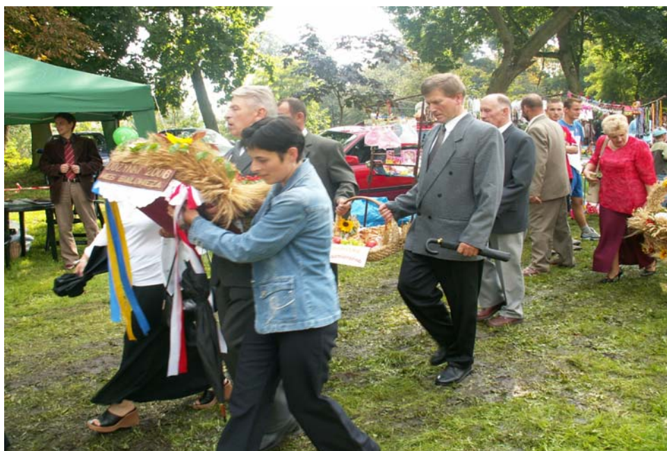
Fot. 5. Dożynki Gminne w Witosławiu 2006r.