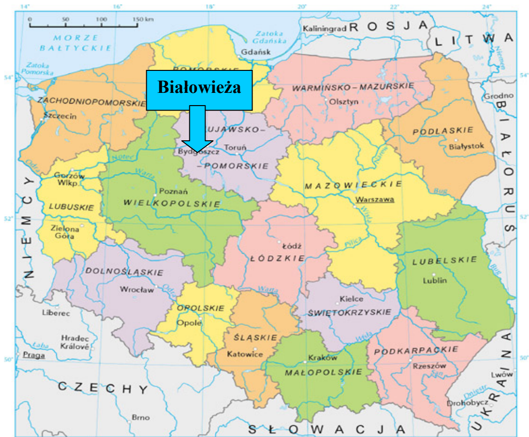
Mapa 1. Położenie Białowieży na tle kraju i województwa.