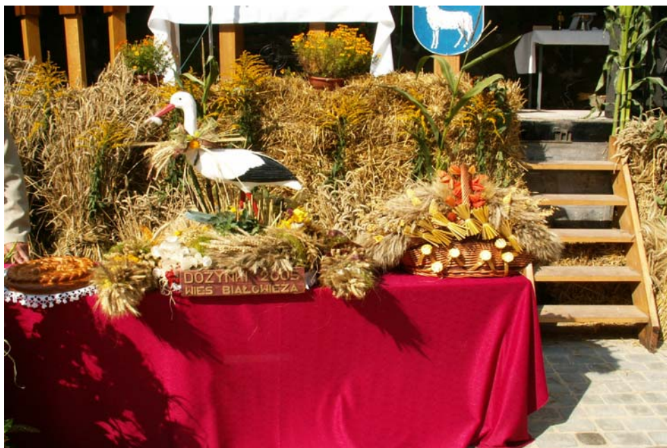
Fot. 4. Dożynki Gminne w Witosławiu 2005r. – wieniec dożynkowy Białowieży

Mieszkańcy Białowieży organizują różne imprezy okolicznościowe, m.in. Dzień Babci, Dzień Dziadka, Dzień Kobiet, Dzień Matki, Dzień Dziecka. Uczestniczą także aktywnie w Dożynkach Gminnych, przygotowują wieńce oraz pieką chleb dożynkowy.