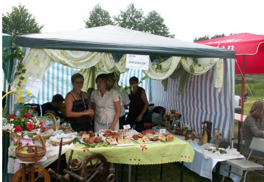
Fot. 12. Stoisko KGW Białowieża