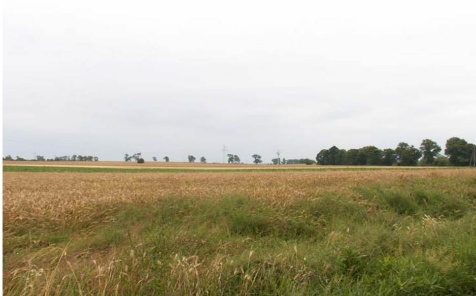
Fot. 1. Krajobraz Białowieży