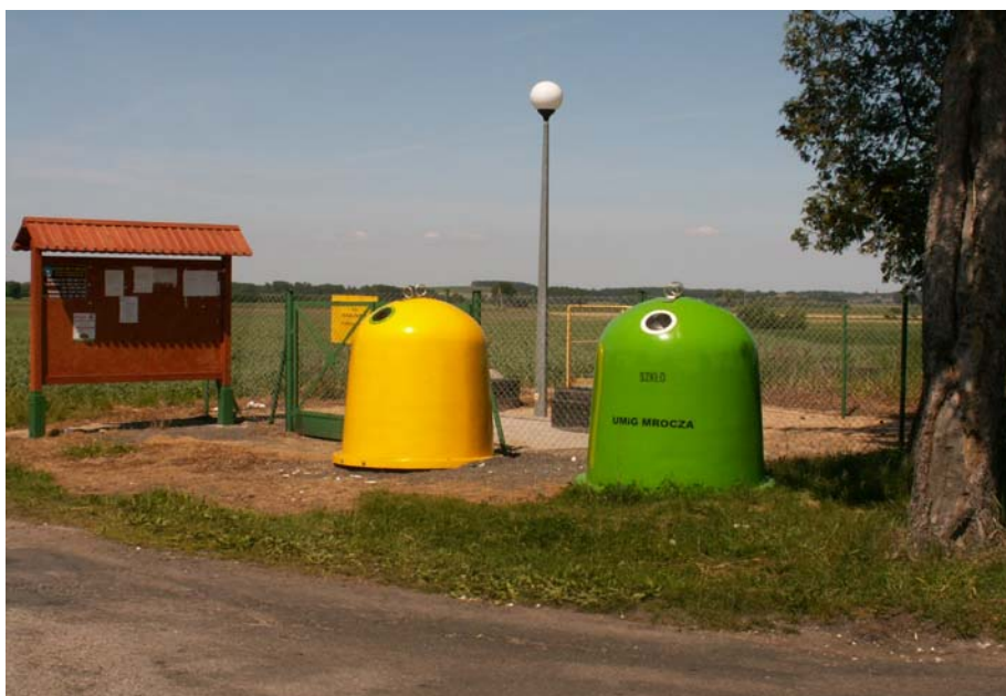
Fot. 7. Pojemniki do segregacji odpadów w Białowieży

W Białowieży jest także sklep spożywczy.