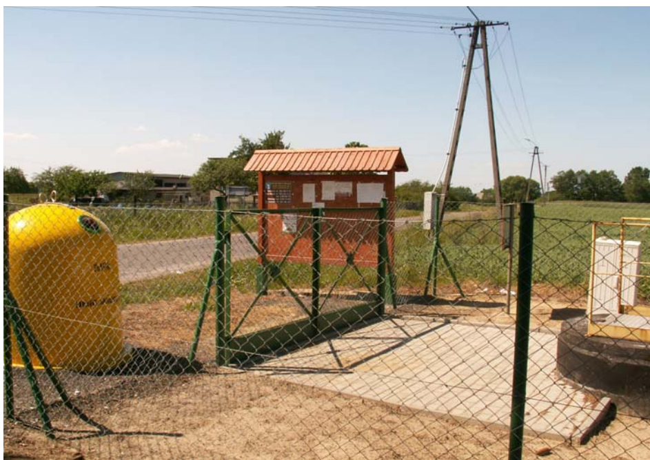
Fot. 9. Kompleks – przepompownia ścieków, pojemniki do segregacji odpadów oraz tablica informacyjna Białowieży.

W miejscowości brak jest boiska sportowego.