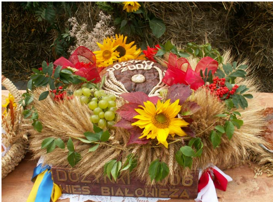
Fot. 6. Dożynki Gminne 2006r.