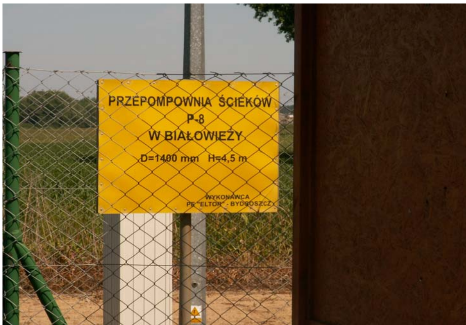
Fot. 8. Przepompownia ścieków