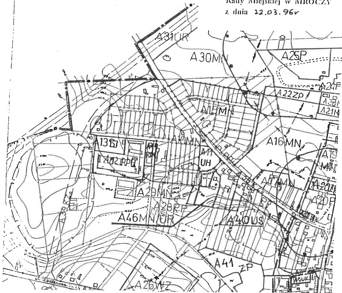
ZMIANA W RYSUNKU MIEJSCOWEGO PLANU OGÓLNEGO ZAGOSPODAROWANIA PRZESTRZENNEGO MIASTA MRO CZY

do Uchwały Nr XVI/121/96 Rady Miejskiej w MRO CZY z dnia 22.03.96r