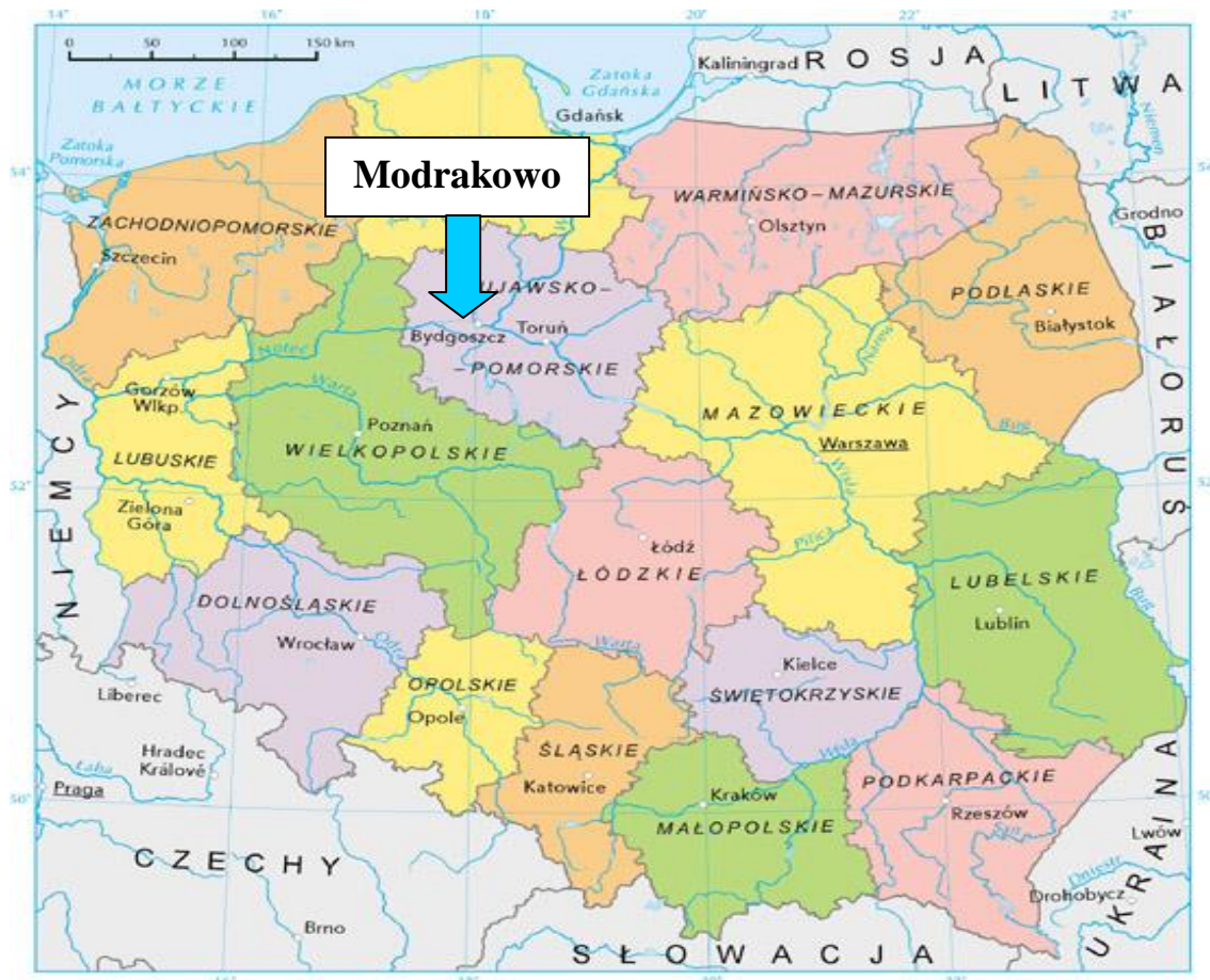
Mapa 1. Położenie Modrakowa na tle kraju i województwa.