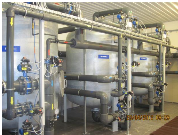
Fot. 7. Stacja Uzdatniania Wody w Modrakowie.

Rozwoju Regionalnego w kwocie 1 787 487,68 zł. W skład zadania poza realizowanymi w latach 2011-2012 inwestycjami polegającymi na przebudowie stacji uzdatniania wody w Modrakowie, budowie kanalizacji sanitarnej w miejscowościach Kosowo i Modrakowo wchodził także zakres realizowany w roku 2009 polegający na budowie kanalizacji Kosowo-Kozia Góra. Całkowita wartość zadania wyniosła 2 904 907,91 zł.