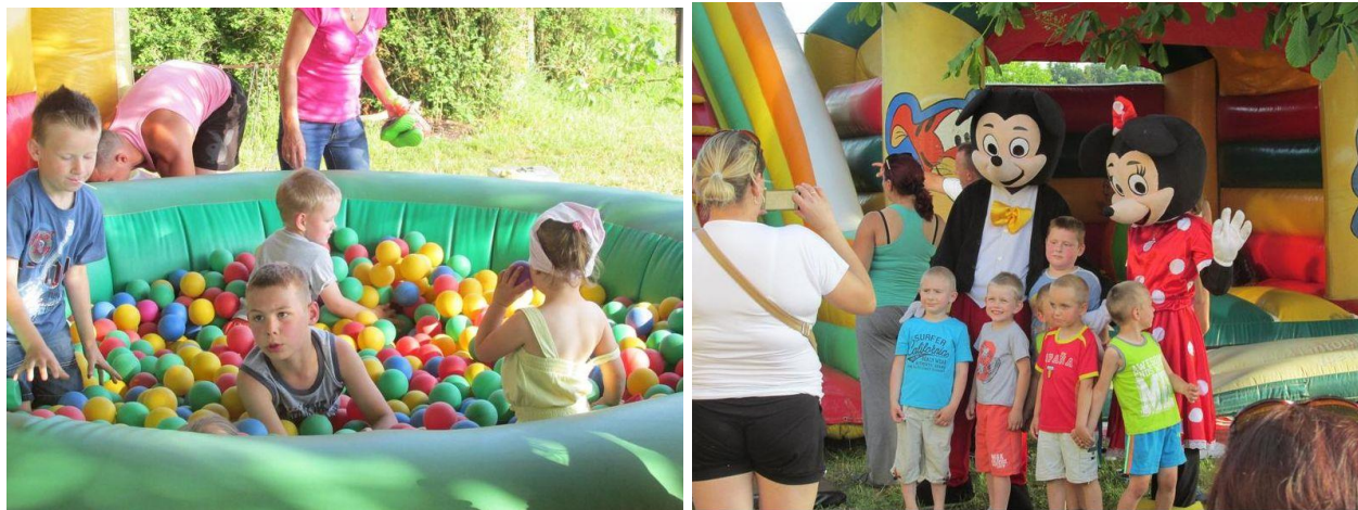
Fot. 10, 11 Piknik Rodzinny w Kosowie