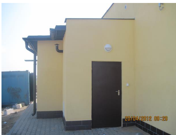
Fot. 8,9. Stacja Uzdatniania Wody w Modrakowie.