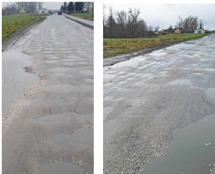
Fot. 1, 2 Droga gminna Kosowo-Modrakowo.

Do miejscowości Modrakowo prowadzi gminna droga gruntowa prowadząca z Kosowa (ok. 1 km odległości), która łączy się z drogą wojewódzką nr 241 Tuchola-Rogoźno. Z uwagi na zły stan drogi gminnej obecnie do wsi Modrakowi nie dociera żaden transport publiczny ani przewoźnicy prywatni. Jedyna komunikacja odbywa się za pośrednictwem prywatnych środków transportu oraz pieszo do miejscowości Kosowo skąd dalej środkami komunikacji publicznej lub z prywatnymi przewoźnikami udają się do pracy, szkoły, lekarza itp. Istotne znaczenie ma niewielka odległość do Nakła nad Notecią (7 km) oraz Mroczy (7 km).