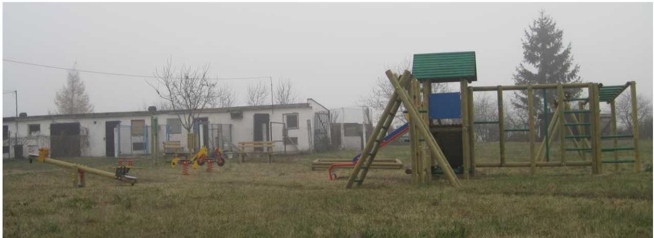
Fot. 6. Plac zabaw w Modrakowie.